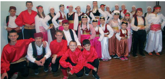
КУД „Актив 4“ Модрича

је обновило свој рад 2013. године. Друштво окупља 50 чланова, распоређених у три секције: фолклорну, плесну и секцију гитаре. Имало је доста наступа на подручју општине Модрича и ближој околини, а прошле године је одржало и свој први самостални концерт. Друштво има за циљ да окупи дјецу и омладину као и одрасле различитих националности, у жељи да покаже да игра и музика треба да зближавају младе људе.