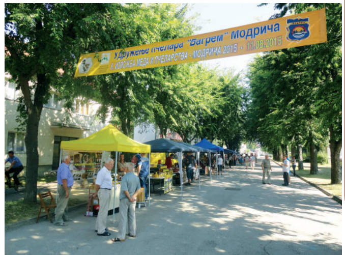
Изложба меда и пчеларства у Светосавској улици

Осма изложба меда и пчеларства "Модрича 2015" одржана је 11. августа 2015. на Тргу Др Милан Јелић. Организатори изложбе били су Удружење пчелара „Багрем“, Туристичка организација општине Модрича и Општинска управа Модрича. Своје производе од меда и других пчелињих производа представило је 15 излагача из Шамца, Петрова и Модриче, а учешће на Изложби узеле су и чланице Удружења жена "Велико срце" из Модриче. Традиционално, на отварању изложбе наступили су малишани Дјечијег обданишта „Наша радост“, након чега су пчелари са поклонима били у узвратној посјети овој предшколској установи. Удружење пчелара „Багрем“ регистровано је 1998. године и тренутно окупља 80 чланова који посједују 4000 кошница, од чега 39 пчелара имају по 50 и више кошница. Основни циљ Удружења је развој, заштита и унапређење пчеларства, производња еколошки чистог и квалитетног природног меда и других пчелињих производа као и заштита животне средине.