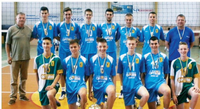
Сјајна генерација модричких одбојкаша

Одбојкаши Модриче у претходној сезони су се такмичили у Првој лиги Републике Српске. У конкуренцији девет клубова Модричани су на крају сезоне заузели високо треће мјесто. Тај