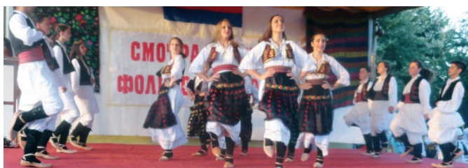
КУД „Савка Мачак“ Скугрић

Културноумјетничко друштво „Савка Мачак“ Скугрић након паузе поново почиње са радом