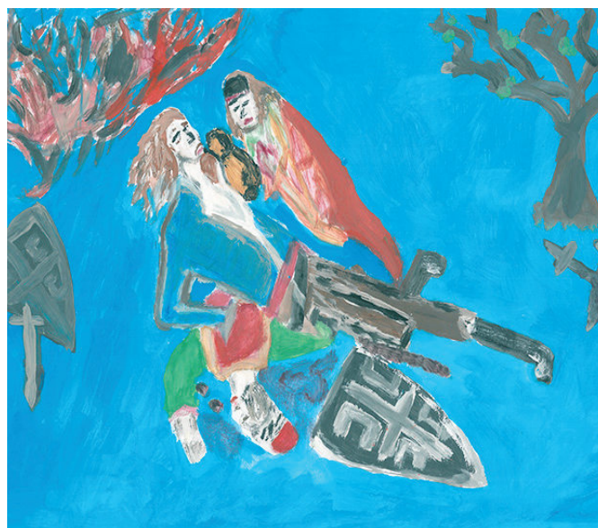
Анастасија Савић: Косовка дјевојка

Милош Обилић живот даде да се српске цркве граде, да се граде богомоље да с' у њима Срби моле.