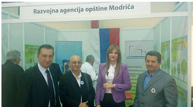
Са 17. међународног сајма привреде у Параћину – представници општина Модрича и Параћин

У периоду од 29. до 31. октобра 2015. у Параћину, Република Србија одржан је Међународни сајам привреде, на којем се представило преко 100 излагача. Отварању Сајма присуствовала је и начелница Одјељења за привреду и друштвене