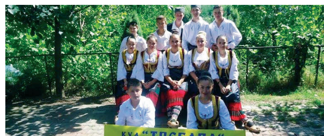
КУД „Требава“ Копривна

традицију и обичаје овога краја све до 1992. године када престаје са радом. У 2009. години друштво поново почиње са радом. У Друштву је тренутно активна само фолклорна секција која окупља близу 50 чланова. Од како је КУД „Требава“ поново почело са радом имало је многе наступе на територији добојске регије, а гостовали су и у Швајцарској. Протеклих годину дана обиљежио је још један наступ у Швајцарској, као и наступи у Брчком, Добоју и Прњавору, а ту су и наступи на подручју општине Модрича.