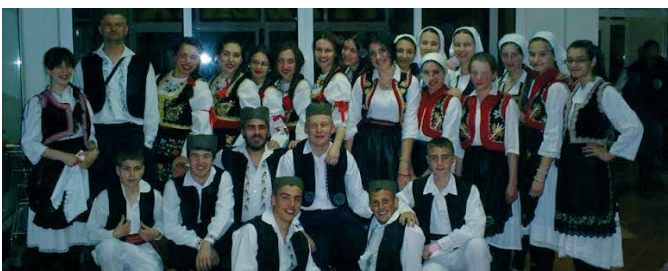
КУД „Врањак“ Врањак

основано је 1972. године. Почетком ратних дешавања престаје са радом. КУД је поново активиран 2008. године и у њему се и данас његује игра и обичаји требавског краја, као и игре других народа. Друштво тренутно окупља око 50 чланова који раде у фолклорној и музичкој секцији. Већина наступа овог КУД-а, од поновног оснивања, била је на територији општине Модрича, а у плану је и гостовање у Швајцарској.