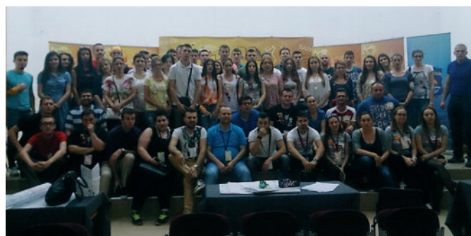
Омладинска банка – Регионални турнир друштвених иновација

Промоција реализованих пројеката преко Омладинске банке Модрича одржана је 2. децембра 2015. године у Скупштинској сали општине Модрича. Том приликом представљено је седам пројеката које су неформалне групе младих из Модриче реализовале у 2015. години: Сређивање старог моста у МЗ Модрича 2, Шеталиште у МЗ Модрича 5, Уређење стадиона у МЗ Дуго Поље, Пагоде за младе подузетне излагаче у МЗ Таревци, Игром до дома у МЗ Борово Поље, Љетна бина у МЗ Скугрић и Уређење школског дворишта у МЗ Ријечани. Укупна вриједност наведених пројеката износи 27.355,37 КМ, од којих је износ од 14.187,50 КМ обезбијеђен као допринос група из заједнице, а износ од 13.167,87 КМ су средства Омладинске банке Модрича. Општина Модрича је у 2015. години за Омладинску банку Модрича обезбиједила 10.000 КМ, од чега је 9.000 КМ намијењено за финансирање пројеката, а 1.000 КМ за јачање капацитета чланова Кредитног одбора и едукацију неформалних група. Општина Модрича од 2008. године учествује у програму Омладинска банка и од тог периода