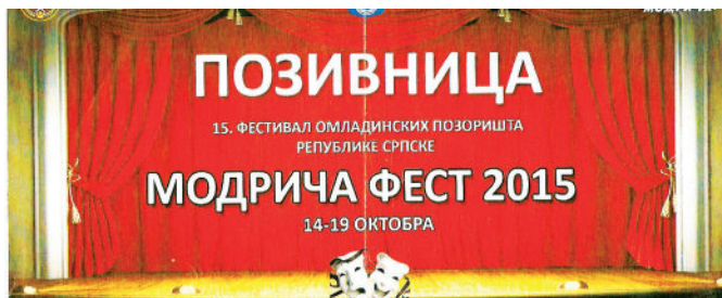
Позивница за Модрича фест

У организацији Дис – Позориште младих Бања Лука, Српског културног центра и општине Модрича у Модричи је од 14. до 19. октобра 2015. године одржан 15. фестивал омладинских позоришта Републике Српске. У такмичарској конкуренцији су наступили Театар Убунту Бијељина ( Интимно ), Театар Сцена