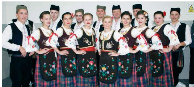
КУД „Зоран Томушиловић Дуго Поље – Ботајица“

Културноумјетничко друштво „Зоран Томушиловић Дуго Поље – Ботајица“ је основано,