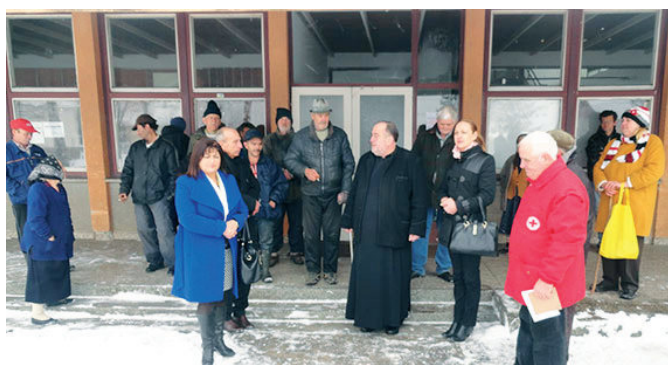
Посјета и помоћ лицима у Колективном центру

Представници општине Модрича сваке године посвећују значајну пажњу корисницима Колективног центра у Доњим Кладарима. У Колективном центру смјештено је 20 корисника, од чега је 17 самаца, двије породице по два члана и једна породица са пет чланова. Седам корисника је из социјално угрожене категорије и због тога користе овај вид смјештаја. Поједини корисници остварују одређена права, и то пет остварују пензију, пет је корисника новчане помоћи Центра за социјални рад и туђе помоћи и