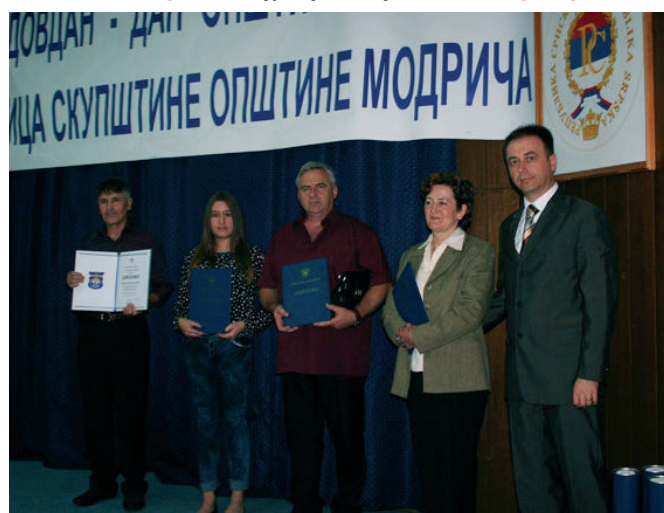
Добитници Диплома за 2015. годину са замјеником начелника

Као и ранијих година и у 2015. години уручене су Новчане награде најуспјешнијим пољопривредним