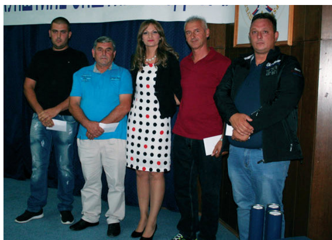
Награђени пољопривредници са начелницом Одјељења за привреду и друштвене дјелатности

Добитник Новчане награде за 2015. годину је Удружење жена „Велико срце“ . „Велико срце“ награђено је за очување народне традиције, хуманитарни рад, као и за рад на подизању и ширењу туристичке свести.