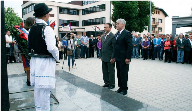
Почаст борцима за Републику Српску поводом Дана општине