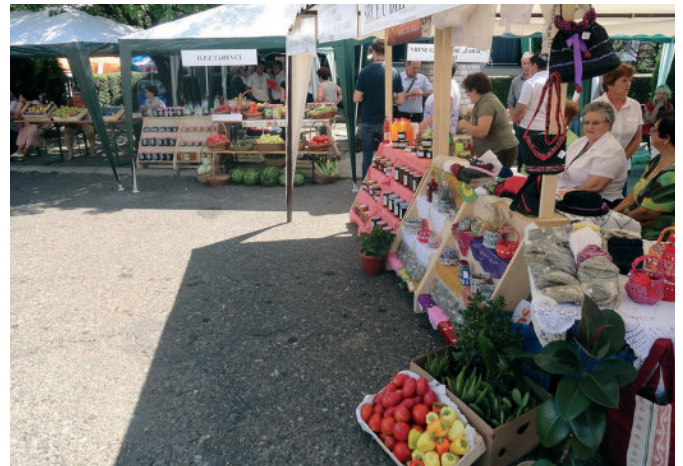
Са сајма у Таревцима