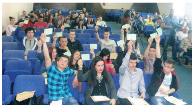
Гласање на сједници Омладинског парламента

Осма сједница Омладинског парламента општине Модрича одржана је 22. априла 2016. године у Плавој сали Српског културног центра. Сједници је присуствовало 18 делегата, који су усвојили Извјештај о реализованим пројектима за школску 2015/16. годину те донијели одлуке о тзв. великим и малим пројектима који ће бити реализовани