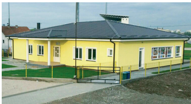
Новоизграђени Дневни центар за дјецу са посебним потребама