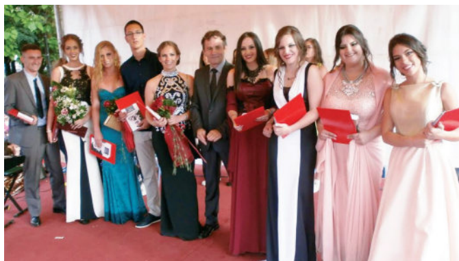
Вуковци из Средњошколског центра „Јован Цвијић“

На регионалним и републичким такмичењима из наставних предмета модрички основци и средњошколци традиционално су показали завидан ниво стеченог знања и вјештина у чему су им несебично помагали предметни наставници и професори.