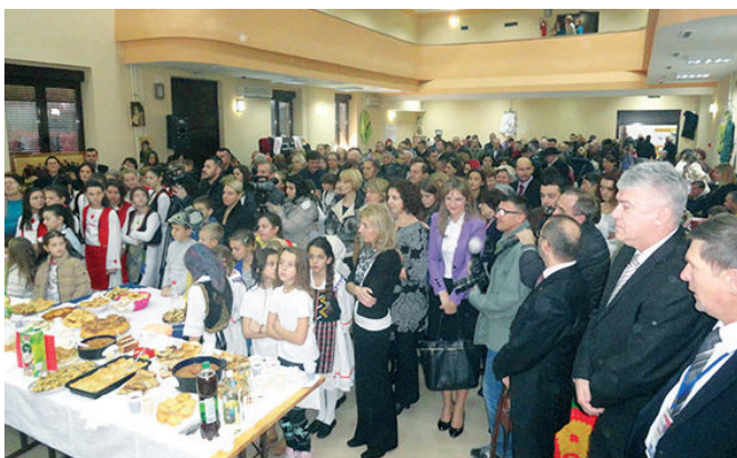
Са свечаног отварања Сајма рукотворина „Традиција и ја“

У Српском културном центру 3. и 4. децембра 2015. године у организацији Туристичке организације, а под покровитељством општинске управе одржан је Сајам рукотворина „Традиција и ја“. Осми по реду сајам