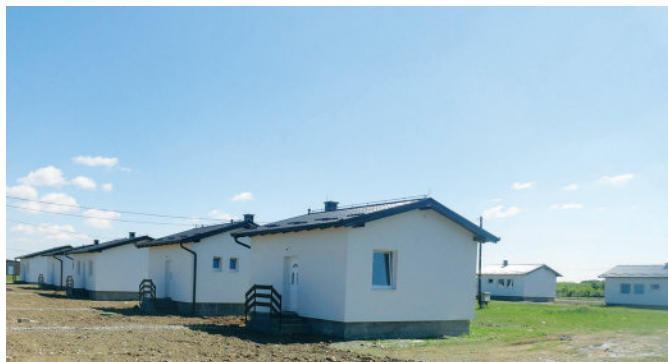
Изградња кућа породицама чије домове су уништила клизишта

У оквиру УНДП програма опоравка од поплава, у општини Модрича у току новембра мјесеца прошле године почела је изградња 15 кућа за лица чији су домови уништени у току и након мајских поплава 2014. године. Сви стамбени објекти, изграђени су у насељу Отежа у мјесној заједници Добрања, осим једног који је изграђен у мјесној заједници Модрича 5 за корисника који је сам обезбиједио грађевинско земљиште. Средства за изградњу објеката су обезбијеђена из УНДП Пројекта опоравка од поплава. За реализацију овог пројекта општина Модрича је обезбиједила грађевинско земљиште, основну комуналну инфраструктуру на парцелама, суфинансирање изградње темеља у износу од 5.000 КМ по објекту, техничку документацију и надзор над извођењем радова и финансијско учешће од 75.000 КМ. Ово је пројекат по принципу кључ у руке. У току поплава у 2014. години на подручју општине Модрича оштећено је или потпуно уништено око 700 стамбених објеката.