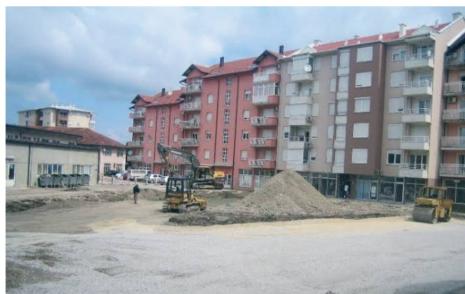
Радови на уређењу паркинга и саобраћајница из обухвата РП „Тржница“

Породице погинулих бораца али и остали грађани су презадовољни чињеницом да су се након толико година ријешили септичких јама. Осим помоћи породицама погинулих бораца, општина Модрича је финансирала израду пројекта секундарне канализације у вриједности 56.300 марака, а из општине обећавају и нова улагања.