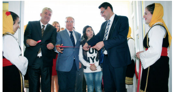
Свечано отварање Дневног центра за дјецу са посебним потребама

корисници, због чега су посебно захвални у Удружењу за помоћ ментално недовољно развијеним лицима Модрича које окупља 95 чланова старосне доби од седам до 60 година. Новосаграђени објекат располаже корисном површином од 276,41 м 2 , док је површина парцеле на којој се налази објекат са двориштем 1122,30 м 2 . Унутар објекта налази се савремено уређен дневни боравак за дјецу, собе, кухиња, просторије за пружање медицинског третмана, простор за вјежбе и играонице.