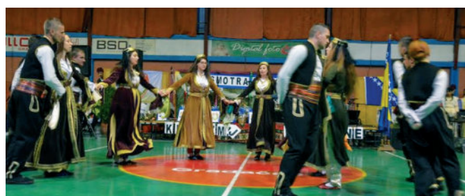
КУД „Шевко Авдић“ Таревци

године, а под данашњим именом ради од 1973. године. Рад и стваралаштво у овом друштву одвија се у више секција: фолклорној, музичкој, драмској, рецитаторској и ритмичкој секцији. Друштво данас броји око 70 чланова. У ранијим годинама, наступали су у Белгији, Њемачкој, Словенији, Хрватској, док се у посљедњих годину дана од наступа издвајају смотре фолклора како на подручју општине Модрича тако и шире.