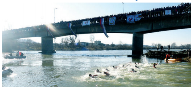
Богојављење - пливање за часни крст

У организацији Српске православне цркве, Светосавске омладинске заједнице и Ронилачког клуба „Видра“ на Богојављење, 19. јануара 2016. године, други