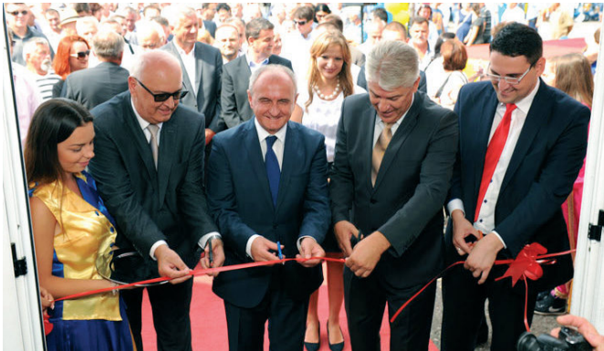
Свечано отварање Шестог сајма привреде „Модрича 2015.“

Шесту годину за редом у сарадњи Развојне агенције општине Модрича, привредника и Одјељења за привреду и друштвене дјелатности општине Модрича 4. и 5. септембра 2015. одржан је Сајам привреде са циљем промоције домаћих привредника, пољопривредника, производа и услуга. Сајам су званично отворили министар привреде,