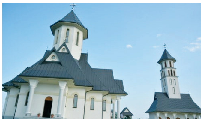
Манастир на Дугој њиви