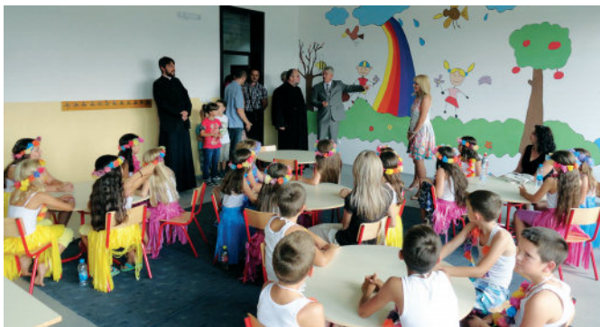
Први дан у новој школи

Објекат новог подручног одјељења Основне школе „Сутјеска“ у мјесној заједници „Модрича 5“ свечано је отворен и осветан 3. септембра 2015. године. На почетку нове школске 2015/2016. године у школске клупе нове школе ушло је 137 ученика, распоређених у седам одјељења од првог до петог