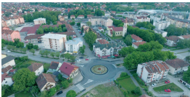
Први кружни ток у Модричи

Модрича је добила први кружни ток у граду, којим ће се регулисати саобраћај на раскрсници између улица Берлинске, војводе Степе Степановића, Гаврила Принципа и Трга Јована Рашковића. Изградња кружног тока финансирана је из општинског буџета у износу од око 75.000 марака, а завршен је за 35 дана.