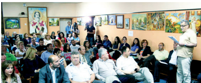
Промоција дванаестог броја Видовданског годишњака

Двадесет треће Видовданско завичајно вече „Косовски божур“ – Пјесници и сликари своје граду и празнику одржано је 25. јуна 2015. године у Српском културном центру. На