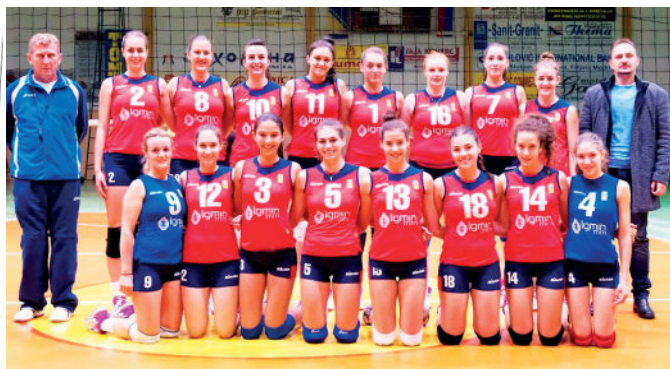
Одбојкашице – традиционално успјешне

Одбојкашице су четврту узаstopну сезону играле у одбојкашкој Премијер лиги БиХ и забиљежиле одличне резултате, пласирале су се у плеј оф. У четвртфиналу испале су од бањалучког „БЛ Волеја“ са 2:1, па су на крају заузеле високо пето мјесто,