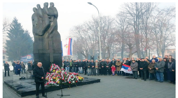
Почаст борцима за Републику Српску поводом Дана Републике