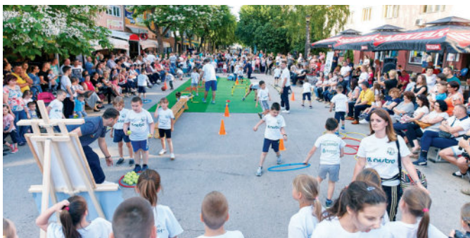
Јавни час спортског клуба „МД- Клинци“

Спортски клуб "МД КЛИНЦИ" је 07.06.2016. године први пут свој ЈАВНИ ЧАС одржао на Тргу др Милана Јелића. Јавни час је редовна манифестација клуба који се одржава на крају сваког полугодишта, гдје се родитељима и другим гостима приказују разне физичке