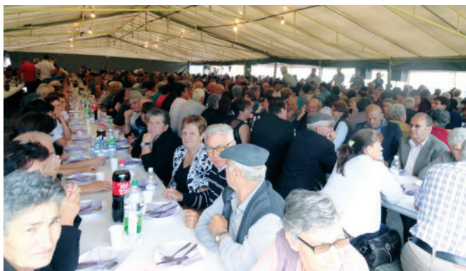
Годишње дружење пензионера у Горњим Ријечанима