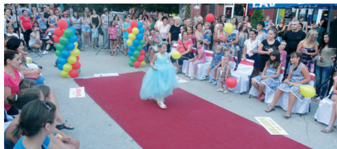
Модричко љето – разноврсни програми и добра посјета

У организацији Туристичке организације општине Модрича, 10. августа отворена је манифестација „Модричко љето 2015“, која је трајала до 14. августа 2015. године. Првог дана одржан је концерт Музичког друштва „Исидор Бајић“ . Другог дана манифестације организована је Модна ревија за дјецу и одрасле на Тргу Др Милана Јелића која је привукла велики број посјетилаца. Моделе дјечијих бутика „Тренд“, „Маја“ и „Бамби“ представило је око 20 модричких малишана на одушевљење присутне публике. У оквиру Модне ревије за одрасле своје моделе приказали су „Хертех“, „А ла моде“ и „М&А-Дана“. Вече су музиком и пјесмом уљепшали чланови Музичког друштва „Исидор Бајић“. За љубитеље спорта трећег дана организовано је Вече спорта на Љетној позорници. Свој рад и успјехе представили су Кошаркашки клуб „Модрича“, Женски одбојкашки клуб „Модрича“ и Кик бокс клуб „Гвардија“. Анимирани филм „Малци“ приказан је четвртог дана на велико одушевљење бројних малишана. Последњег дана манифестације организовано је кароке такмичење пјевача аматера под називом „ Микрофон је ваш “.