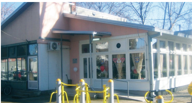
Центар за здраво старење у Модричи