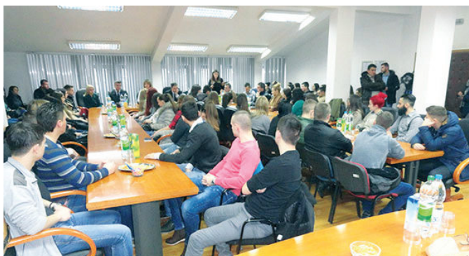
Свечано потписивање уговора о стипендирању

У Скупштинској сали општине Модрича дана 04. јануара 2016. године потписани су уговори о стипендирању нових студената којима је стипендија додијељена први