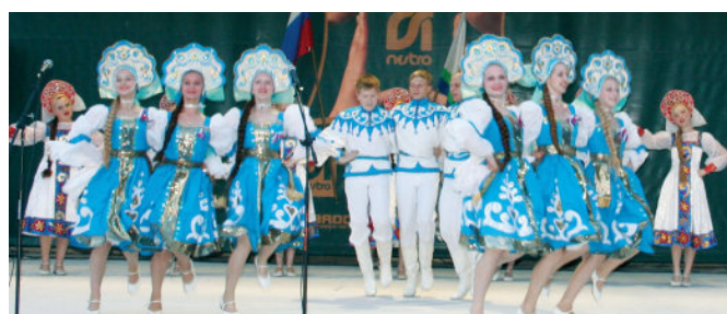
Руски фолклор на Љетној позорници у Модричи