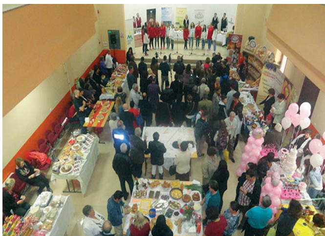
Трећи гастро сусрети „Модрича 2016.“

Трећа по реду привредно-туристичка манифестација "Гастро сусрети" одржана је 10. маја 2016. године у организацији Туристичке организације општине Модрича. Том приликом представио се 21 излагач са подручја добојске и семберске регије, а њихов заједнички циљ је био дружење и представљање дијела богате гастрономске понуде краја из којег долазе.