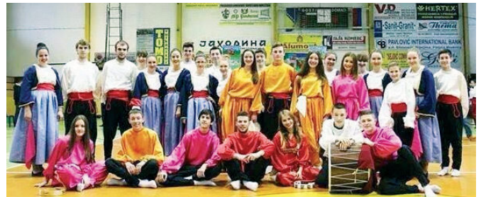
КУД „Завичај“ Модрича

је основано 2007. године у мјесној заједници