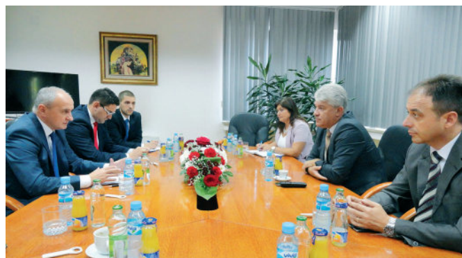
Замјеник начелника са министрима из Владе РС