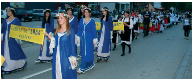
Видовдански дефиле улицама Модриче

Поводом Видовдана - Дана општине 27. јуна 2015. године одржано је 11. Видовданско вече музике и фолклора. Манифестација је почела дефилеом улицама града уз пратњу добојских трубача и културно-умјетничких друштава са подручја општине Модрича. Програм су почеле Модричке мажореткиње,