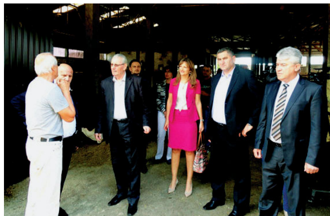
У посјети пољопривредним произвођачима са министром пољопривреде

Пољопривреда, као грана привреде, је велика развојна шанса Модриче, оцијењено је у Одјељењу за привреду и друштвене дјелатности и у складу с тим развоју пољопривреде и села се посвећује максимална пажња. У општинском буџету је за пољопривреду у 2016. години предвиђено 115 хиљада марака за субвенције и подстицаје: „Од предвиђених средстава у буџету општине која се издвајају за развој пољопривреде и села, 60% се издваја за подстицање пољопривредне производње у сточарству, пчеларству, воћарству и повртларству, а око 40% за јачање задружног сектора, удружења, организовање сајмова, посјете пољопривредних произвођача другим сајмовима, едукацију пољопривредних произвођача и ванредне помоћи. Осим тога за развој пољопривреде чине се додатни напори да се обезбиде средства и