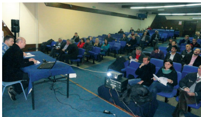
Са Јавне расправе о Нацрту буџета