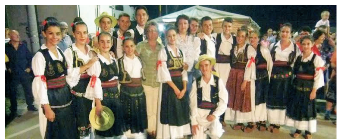
КУД „Милошевац“ Милошевац