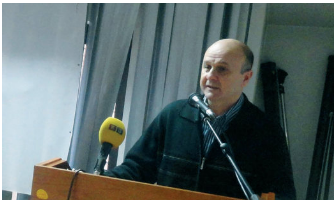
Начелник Одјељења за финансије

Општински буџет за 2015. годину је првобитно планиран у износу од 9.000.000 КМ. Након извршеног ребаланса, буџет је повећан на 9.648.000 КМ, односно за 7,20%. Ребалансом је планирано повећање прихода за 618.300 КМ. Највеће повећање у износу од 250.000 КМ је предвиђено код прихода од индиректних пореза. На крају године укупно остварени буџет је износио 10.091.071 КМ, од чега су буџетски приходи износили 9.103.258 КМ, грантови 3.492 КМ, трансфери 543.449 КМ и примици 440.872 КМ. Остварени буџет је био већи од ребаланса за 443.071 КМ. Овај пребрајај остварен је захваљујући ефектима мултилатералне компензације у износу од 425.563 КМ. Захваљујући тој чињеници, као и уштедама на страни буџетске потрошње, остварен је буџетски суфицит у износу од 631.176 КМ. Из наведених података искључени су трансфери од стране виших нивоа власти који су уплаћени директно на рачун добављача у износу од 180.027 КМ. Остварени буџетски приходи у 2015. години већи су од остварених прихода у 2014. години за 651.606 КМ што је резултат повећане наплате прихода од индиректних пореза који су повећани за 560.369 КМ. У поређењу са 2014. годином, укупан буџет у 2015. години већи је за 1.116.862 КМ.