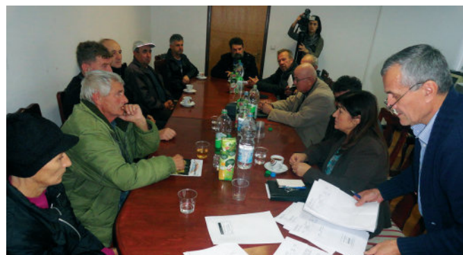
Преузимање рјешења о додјели бесповратних новчаних средстава

У општини Модрича крајем прошле године уручена су рјешења о додијели бесповратних новчаних средстава за стамбено збрињавање борачке популације. На конкурс за стамбено збрињавање бораца I категорије и ратних војних инвалида од VI - X категорије, који општина Модрича расписује посљедњих десет година, пријавило се 57 породица. Након урађене процјене Стамбене комисије одобрено је 50 захтјева, од чега 42 захтјева бораца, пет ратних војних инвалида и три породице погинулих бораца. Укупан новчани износ за одобрене захтјеве износио је 39.500 КМ. Одобрена помоћ се кретала од 500 до 1.500 КМ. Акцент је био на борцима I категорије који нису стамбено збринуте, а нису изостављене ни породице погинулих бораца и ратни војни инвалиди нижих категорија. Одбијено је седам захтјева из разлога што су стамбено збринуте или живе у туђој имовини или у старим кућама у које нема сврхе и није могуће улагати средства. На листу предложених кандидата и висину одобрене новчане помоћи сагласност је дала Борачка организација општине Модрича. По општинској Одлуци