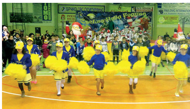
Вече дјечије радости

У Спортској дворани у организацији општине Модрича и Српског културног центра традиционално је 28. децембра 2015. године организована манифестација Дјечија нова година , највећа манифестација дјечије радости у нашем граду. За најмлађе становнике обезбијеђено је 3500 пакетића. Поред општине Модрича у куповини пакетића учествовало је још 30 модричких предузећа, установа и појединаца. Овом приликом приређен је богат културно - забавни програм у коме су учествовали: Музичко друштво „Исидор Бајић“, ритмичке секције основних школа „Свети Сава“ и „Сутјеска“, Модричке мажореткиње и Позоришна сцена младих из Културноумјетничког друштва „Модрича“ и Дјечије обданиште „Наша радост“. Програм је био разноврстан и прилагођен узрасту малишана. Највише радости је изазвала појава Дједа Мраза и подјела пакетића. Ова манифестација постала је најмасовнија не само на подручју општине него и на територији цијеле регије у којој не уживају само дјеца већ и њихови родитељи.