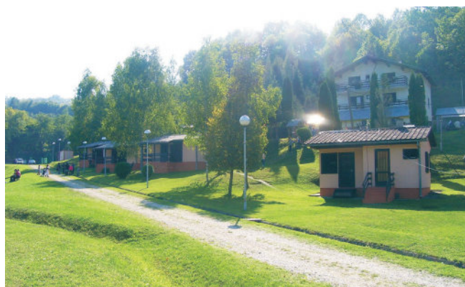
Спортскорекреативни центар Горњи Ријечани

Времешни аутомобили нису препуштени забраву, поново су постали љубимци на четири точка: „У оквиру ‘Видовданске недеље’ у Модричи је прошле године одржана прва изложба старих аутомобила, односно изложба олдтајмера. Љубитељи времешних аутомобила имали су прилику да уживају поред 19 аутомобила старијих од 30 година и у неколико мотоцикала. Највећу пажњу посјетилаца закупили су ‘мерцедес’ из 1962. године и амерички ‘линколн’ из 1973. године.“