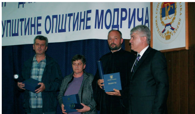
Добитници Плакете за 2015. годину са начелником општине

Свечана сједница Скупштине општине Модрича, која се одржава на Видовдан, Дан општине Модрича, сваке године повод је да се истакнутим научним, спортским, културним радницима и другим појединцима и колективима који су дали значајан допринос развоју и афирмацији општине Модрича уруче награде и признања.