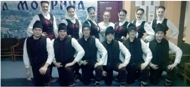
КУД „Модрича“ Модрича

основано је 2007. године како би наставило традицију Прве Светосавске академије из 1886. године те Српског културнопросвјетног друштва „Просвјета“ (1902) и Српског православног пјевачког друштва „Зора“ (1903), која су више пута забрањивана. У оквиру друштва активне су: драмско-рецитаторска и фолклорна секција, позоришна сцена младих, мажореткиње и Етно група „Вида“. Све секције броје око 220 чланова. У последњих годину дана имали су бројне наступе на територији општине Модрича и регије, као и наступе у Апатину и Новом Саду.