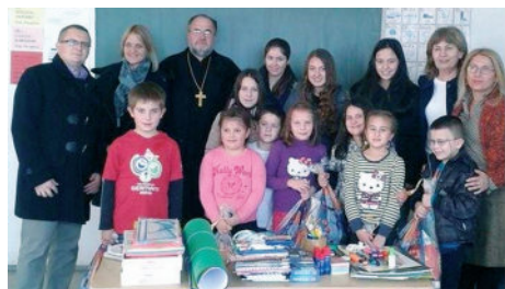
Једна од акција Хуманитарне организације „Срцем за Модричу“

Све је више колектива, организација, удружења и појединаца који се укључују у хуманитарне акције чиме се шири круг хуманости и солидарности.