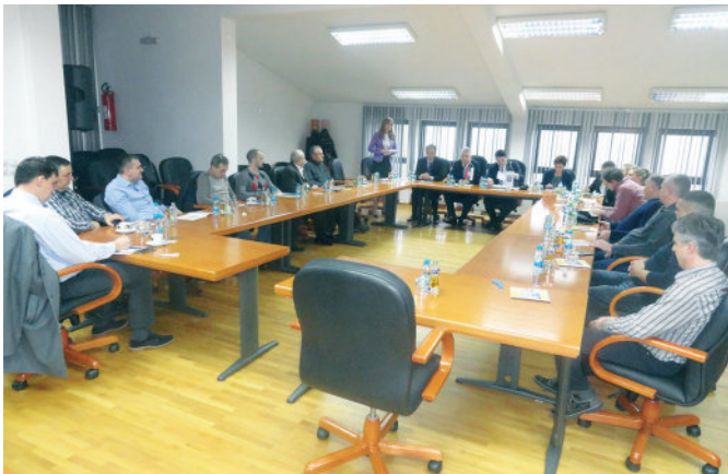
Округли сто „Изазови и препреке у спољнотрговинском пословању“

из других извора што је у протекле двије године износило преко 600.000 КМ. “