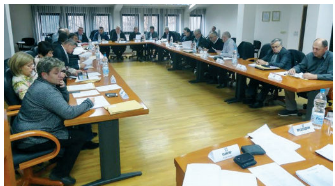
Одборници Скупштине општине Модрича