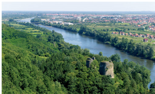
Туристички потенцијал: планина, равница, ријека, историјски споменици

Има Модрича и свој спортско – рекреациони центар, бисер природе на планини Требави: „Спортско - рекреациони центар Ријечани је смјештен у једном од најљепших дијелова Требаве, у селу Горњи Ријечани удаљеном око 12 км од центра Модриче. У питању је еколошки очуван природни амбијент који је погодан како за љетње тако и за зимске рекреативне садржаје. Центар располаже са централним објектом у којем се налазе 3 сале погодне за одржавање семинара и конференција са капацитетом од 100 мјеста, те 8 соба за ноћење. У склопу Центра се налази и 10 викенд кућица са по три собе, купатилом и ходником, те наткривеним терасама на којима се проводе незаборавни