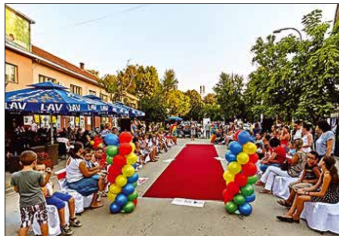
Модричко културно љето