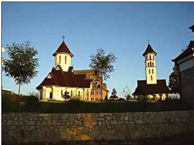
Манастир Светог пророка Илије на Дугој њиви

Јавна установа Туристичка организација „Модрича“ општине Модрича почела је са радом 2008. године са циљем промоције туристичког производа и побољшања туристичке понуде, као и унапређења и промоције изворних вриједности, како би се употпунили туристички и културни садржаји у Модричи. У свом програму рада садржи активности организовања манифестација као што су Гастро сусрети, Сајам рукотворина Традиција и ја, обиљежавање Свјетског дана животне средине, Изложба дигиталне фотографије. „Једна од значајнијих манифестација је Модричко љето , која има све већи значај. Циљ манифестације је да се повећају и употпуне културна, забавна и спортска дешавања у љетном периоду.