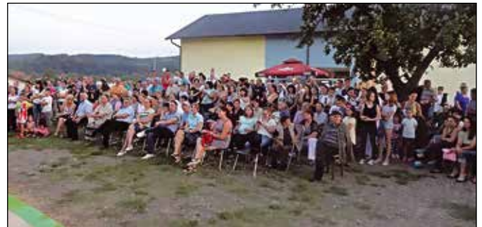
Велико интересовање за Трећу смотру фолклора

реализацију. Публика је уживала у богатству и разноврсности игре и костима и срдечно поздравила све учеснике у програму. Након смотре фолклора одржан је ноћни турнир у фудбалу који је привукао велики број екипа и изазвао велико интересовање публике.