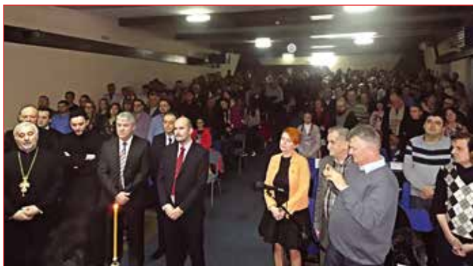
Светосавска академија – традиционално пуна сала

Двадесет пета Светосавска академија је почела српском химном Боже правде и Химном Светом Сави. Часни оци