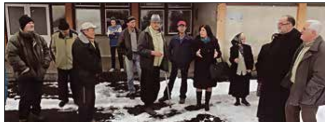
У једној од посјета Колективном центру

лица ООЦК бесплатно свакодневно обезбјеђује хљеб, а повремено и друге намирнице.