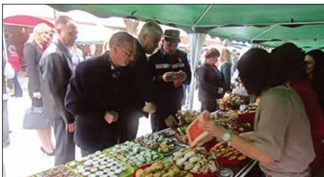
На Четвртим Гастро сусретима „Модрича 2017.“

У организацији Туристичке организације општине Модрича 28. априла 2017. године у пјешачкој зони Светосавске улице одржани су „Гастро сусрети Модрича 2017.“ Том приликом своје специјалитете представио је 21 излагач са под-