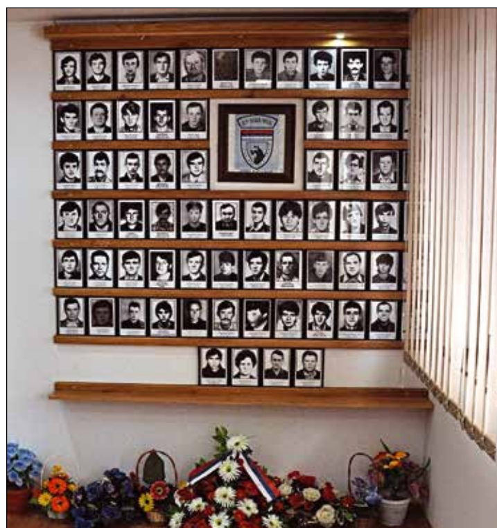
Погинули борци Првог батаљона Вучијачке бригаде (70 фотографија, недостаје још 12)