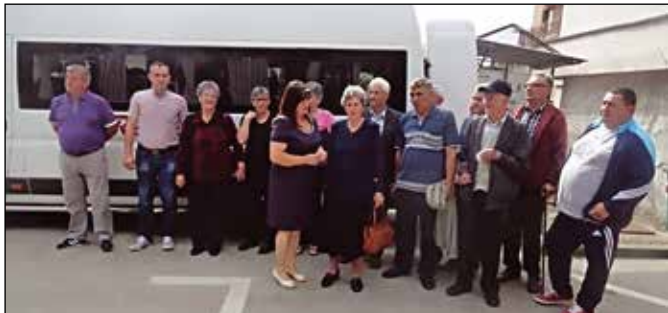
Испраћај на бањско лијечење

Министарство рада и борачко-инвалидске заштите РС Пројектом бањске рехабилитације РВИ и чланова ППБ за 2016. годину предвидјело је рехабилитацију 568 лица из РС у неколико бањско-климатских здравствених установа. У оквиру овог пројекта из Модриче је 13 лица, којима је овај вид здравствене заштите препоручен од стране љекара и који до сада нису користили то право упућено је на бањско лијечење у Здравствено-туристички центар „Бања Врућица“ у Теслићу. Трошкове бањске рехабилитације сноси ресорно министарство, а трошкове превоза општина Модрича. Пројекат бањске рехабилитације реализује се од 2006. године. До сада је право на бањско лијечење користило 138 лица из Модриче, од чега 73 РВИ и 65 чланова ППБ.