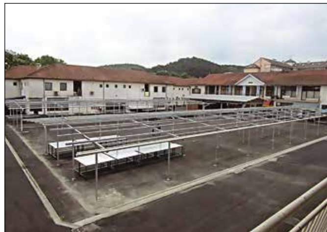
Нова пијаца у изградњи