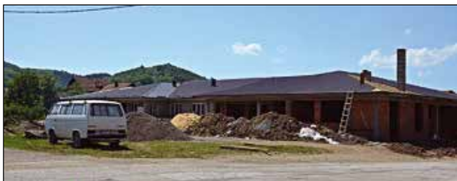
Обданиште у изградњи

У оквиру наставка сарадње општине Модрича и швајцарске фондације „Oberwallis - За дјецу нашег свијета“ почетком