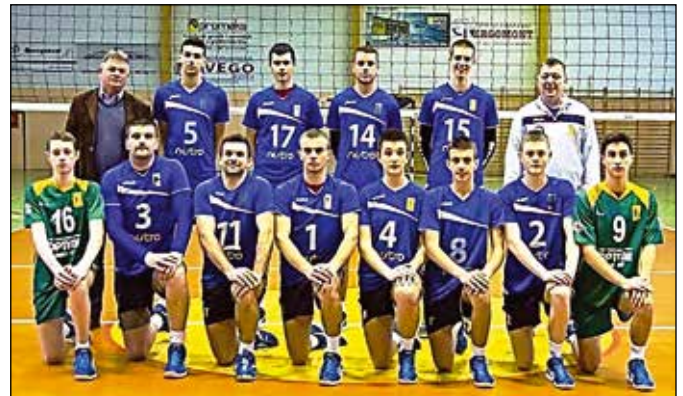
Шампиони Републике Српске

неколико репрезентативаца који ће учествовати на Балканијади и на тај начин репрезентовати ове просторе.