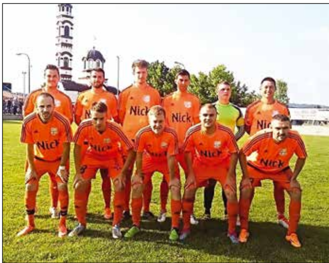
ФК „Врањак“ – нови друголигаш

Некадашњи шампион и освајач Купа Републике Српске и БиХ, Модрича завршила је учешће на друголигашком “западу” како је могла и знала. Приоритет је био да се нагомилани проблема у функционисању овог колектива превазиђу те да се од љета крене у стварање тима који би у наредној сезони изборио повратак у Прву лигу Републике Српске. У знак сјећања на Милана Јелића, шестог председника Републике Српске и председника ФС РС и ФС БиХ, организован је седми Меморијал “Др Милан Јелић”. Окупио је кадете из Републике Српске, Федерације БиХ и Србије, а побједник је била београдска Црвена звезда. Фудбал се буди и у модричким сеоским срединама. Тако је ФК “Врањак” уз свој 42. рођендан изборио пласман у 2. лигу Републике Српске. Остварили су резултате за сваку похвалу, највеће у минулој деценији. Заједно са Модричом, такмичиће се на друголигашком “Западу” и на тај начин репрезентовати Модричу на фудбалској сцени. Пласман у виши ранг остварили су ФК “Слога” Јакеш, ФК “Требавац” из Врањака, док је ФК “Слога 1964” из Скугрић играла у финалу ОФС Модрича.