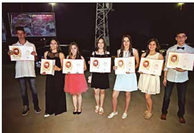
Вуковци из Основне школе „Свети Сава“

Дипломе Вук Стефановић Караџић се додјељују ученицима основних и средњих школа који су за вријеме основношколског или средњошколског образовања у свим разредима и из свих предмета имали одличан успјех и примјерно владање. Само ти ученици знају колико је за такав успјех требало концентрације на часовима, учења код куће, колико је страница требало прочитати и колико задатака ријешити, како бити одличан и примјеран свих девет односно четири године, како се не опустити никада и ни на један тренутак. Зато ти ученици заслужују наше поштовање и посебна признања. Очекивати је од њих да тако исто буду и успјешни студенти и да буду они ти који ће касније бити главни носиоци нашег привредног и уопште друштвеног развоја. На завршетку школске 2016/2017. године Диплому Вук Стефановић Караџић добило је укупно 25 ученика завршних разреда модричких основних и средњих школа.