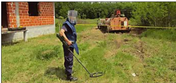
Деминери на задатку

Листа приоритета деминирања за 2016. годину садржала је 12 задатака површине 354.704 квадратних метара. Током