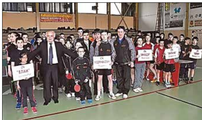
СТК “Модрича спин”