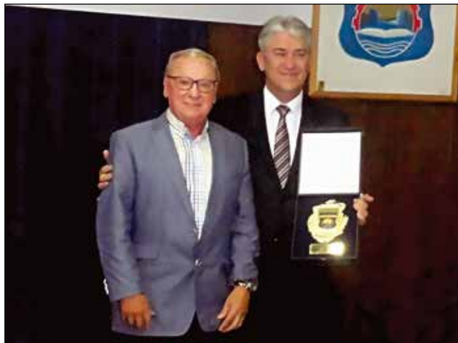
Повеља Фондацији „Oberwallis – Дјеца нашег свјета“

Видовдан, Дан општине Модрича, сваке године повод је да се истакнутим научним, спортским и културним радницима, пољопривредницима, најуспјешнијим ученицима и другим појединцима и колективима који су дали значајан допринос друштвеном, привредном, културном и спортском развоју и афирмацији општине Модрича или се истакли у хуманитарним активностима уруче награде и признања. Као и претходних година награде и признања уручене су на Свечаној сједници Скупштине општине Модрича, која се и одржава на сам Видовдан, 28. јуна. У 2016. години одлуком Скупштине општине Модрича додијељена је једна Повеља, као највеће општинско признање, три плакете, пет диплома, једна новчана награда, осам похвала за најбоље ученике, као и три новчане награде најуспјешнијим пољопривредним произвођачима.