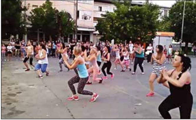
Са једне од манифестација Модричко љето 2016.

У организацији Туристичке организације општине Модрича манифестација Модричко љето 2016. је трајало од 2. до 5. августа 2016. године. Првог дана мани-