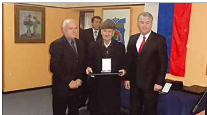
Додјела одликовања породицама погинулих бораца

У 2016. години у општини Модрича су за четрдесет и двије породице погинулих бораца уручена Одликовања