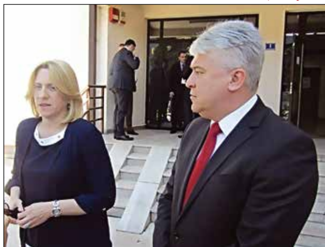
Начелник општине са председницом Владе РС у Модричи