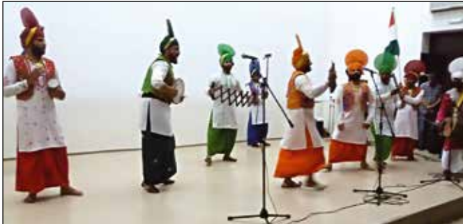
Са Дукатфеста у Модричи

Девети интернационални фестивал фолклорних ансамбала „Дукатфест“ одржан је 19. јуна 2016. године у Кино сали Српског културног центра у Модричи. На овогодишњем фестивалу модричка публика је имала прилику да ужива