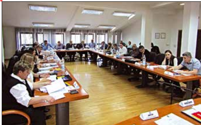
Новоизабрани одборници на сједници СО

15. Либерална странка Босне и Херцеговине - ЛС БиХ: 2 гласа или 0,01% или 0 мандата