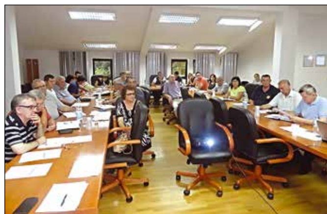
Задатак за новоизабране кадрове - Стратегија интегрисаног развоја општине

Током рада Скупштина је јасно показала ко ће представљати скупштинску већину, а ко опозицију. Очигледно је да ће власт имати стабилну скупштинску већину што ће јој омогућити лакше функционисање.