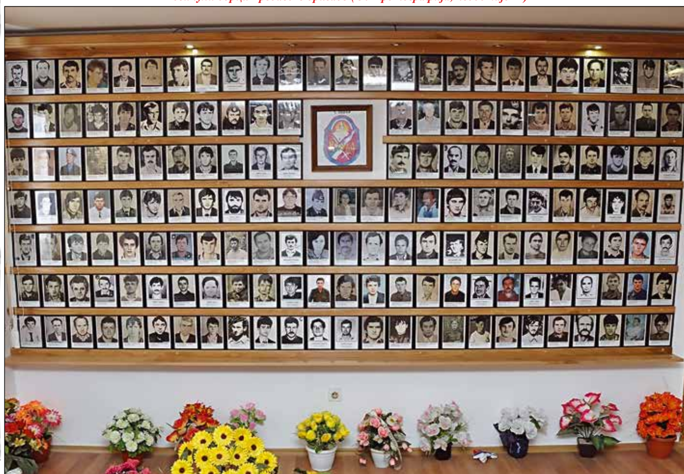
Погинули борци Четврте озренске бригаде (169 фотографија, недостаје још 37)