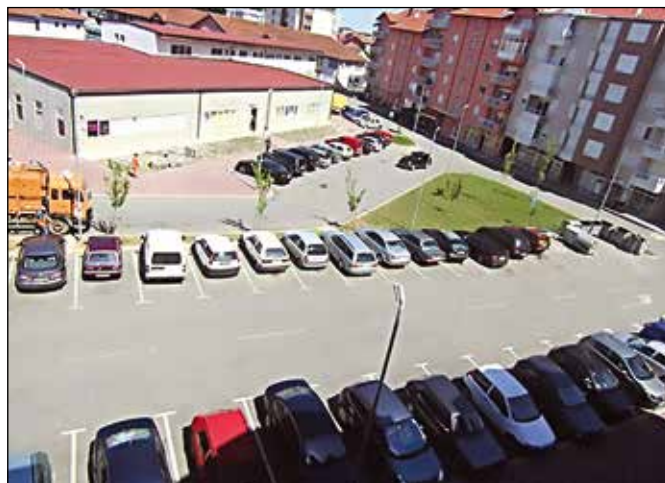
Уређен паркинг простор

У Модричи су у току радови на реконструкцији и доградњи зелене пијаце вриједни око 300 хиљада марака: „Пијаца је у власништву предузећа ‚Комуналац‘, али свака инвестиција је за поздравити ако је у функцији општине Модрича и њених грађана, а пијаца свакако јесте и то и оних из града и са села једнако. Најважније је да ће град добити савремени објекат комуналне намјене који ће обрадовати и продавце и купце. Стара зелена пијаца саграђена је прије 60 година и од тада до сада на њеној модернизацији мало тога је урађено. Површина нове зелене пијаце биће 2.600 квадратних метара, од чега ће 800 бити наткривено, а затворени простор биће на 110 квадратних метара гдје ће бити простор за продају млијечних и месних производа, а предвиђене су и просторије за инспекцију, управу пијаце и тоалет.“