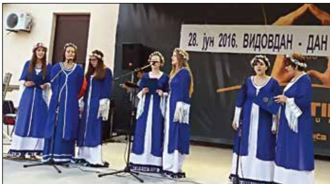
Етно група „Вида“ КУД-а „Модрича“ на Видовданској вечери

Поводом Дана општине – Видовдана 1. јула 2016. године одржано је Видовданско вече музике, пјесме и фолклора, на Љетној позорници Српског културног центра. Манифестација је почела дефилеом културноумјетничких друштва