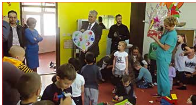
Дјечија недјеља у Дјечијем обданишту

Дјечија недјеља је одржана од 3 - 7. октобра под слоганом „Породица на првом мјесту“, а дјеца су кроз игру говорила о својим правима. Поводом Дјечије недјеље у обданишту „Наша радост“ одржан је Дан отворених врата у току којег су родитељи имали прилику да у обданишту проведу вријеме са својом дјецом и увјере се у услове боравка дјеце и рада са њима. Малишане из вртића посјетили су и представници локалне управе и уручили им поклоне. Поред Дана отворених врата у ЈПУ „Наша радост“ Дјечија недјеља је обиљежена и другим активностима, како ове установе тако и основних школа. Организоване су радионице на тему дјечијих права, приредбе, спортски дан, музичке активности.