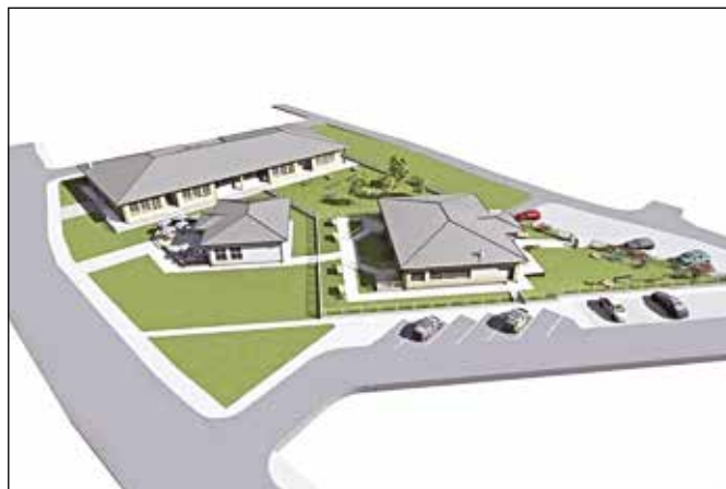
Макета новог обданишта