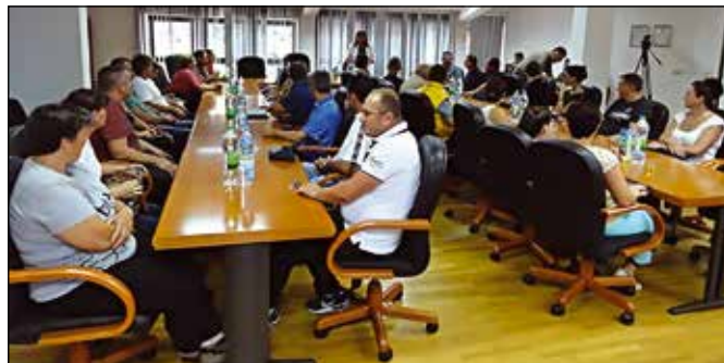
Подјела накнада за уџбенике

Општина Модрича посебну пажњу поклања школовању дјеце ППБ и РВИ. Право на накнаду за уџбенике имају дјеца ППБ, РВИ од I–IV категорије инвалидности који похађају основну и средњу школу, као и дјеца РВИ од V–X категорије који имају троје и више дјеце, а која похађају школу. За школску 2016/2017. годину право на накнаду у износу од 100 КМ имао је 51 ученик, дјеца РВИ. Дјеца ППБ су завршила средњошколско образовање и уписала факултет, због чега је уведено право на набавку уџбеника за ове студенте, у износу од 200 КМ. Ово право остварује 26 студента. Дјеца ППБ и РВИ поред права на исплату за уџбенике, имају право и на накнаду за превоз, ђачке екскурзије, студентске стипендије и студентске екскурзије.