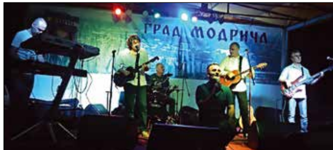
„Легенде“ поново у Модричи

Гранит, Којо комерц, Миос, Медиа, Сион ГМ, Лион, Инстел, Кемокоп, Клас, Промакс, Балегем, Тим траде, Аква, Терра, Гранини, Рокс, Голден Роз, УГ Коноба Воденица и Еурос осигурање.