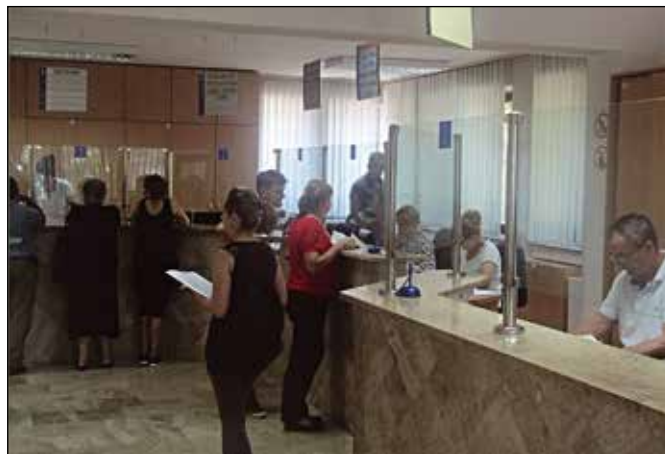
Пријемна канцеларија - брза и квалитетна услуга