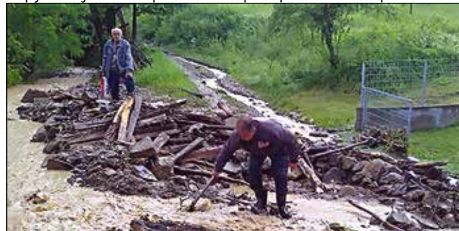
У борби са бујицом

процијењене штете видјеће се у којој мјери се може помоћи, поручено је овом приликом из ресорног министарства.