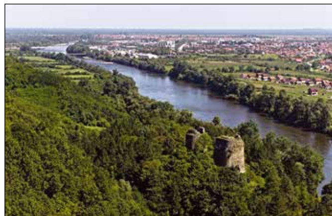
Град на обали ријеке Босне