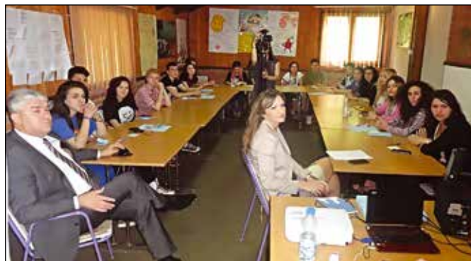
Љетни камп младих у Горњим Ријечанима

Асоцијација средњошколаца у БиХ, Локални тим Модрича од 20. до 23. јуна 2016. године организовао је Љетни камп у Ријечанима. На Љетном кампу је учествовало 20 средњошколаца из Бања Луке, Брчког, Сребреника, Источног Сарајева, Грачанице, Оџака, Прозора, Орашја, Живиница и Модриче. Током четири дана боравка у кампу средњошколци су имали прилику да се едукују на тему тимског рада, солидарности и толеранције. Камп су посетили и представници општине Модрича који су дали велику подршку Асоцијацији средњошколаца. Асоцијација је основана 2007. године са основним циљем побољшања статуса средњошколаца у цијелој БиХ кроз реализацију њихових идеја и заступања права. Асоцијација дјелује путем Локалних тимова који дјелују у 50 градова широм БиХ.