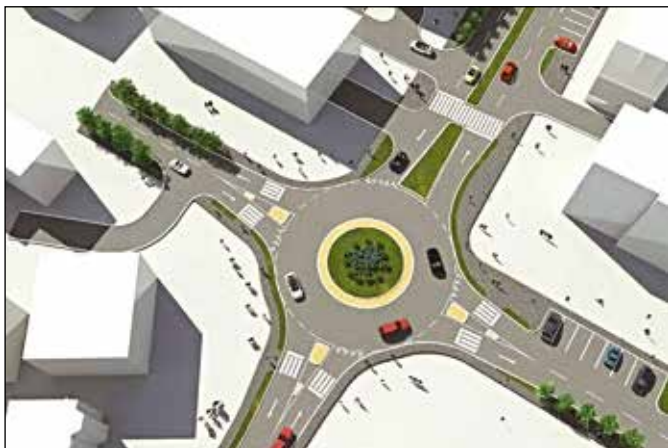
Макета друге кружне раскрснице у Модричи

Нова зелена пијаца биће мали економски центар у овом граду. Биће више уведено реда на пијаци, биће чистија, здравија и функционалнија. Нећемо имати прашине, блата, одлагања производа на нехигијенском простору. Пијаца ће редовно да се чисти и пере, имаће добру одводњу, нов кров, уређене тезге, укратко - све ће бити ново, чисто, савремено и функционално.“