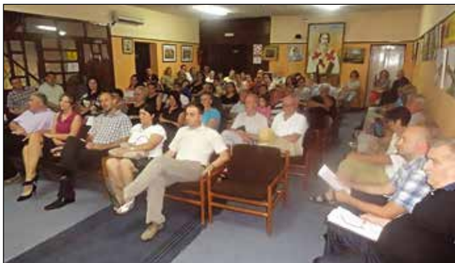
Са 24. Видовданске вечери

Двадесет четврто Видовданско завичајно вече Косовски божур – Пјесници и сликари своје граду и празнику одржано је 24. јуна 2016. године у Српском културном центру.