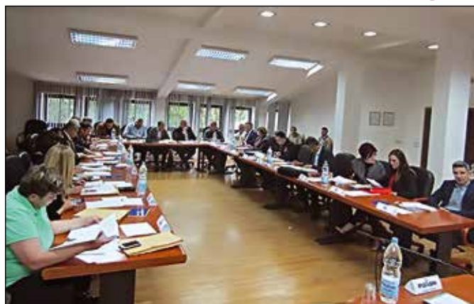
Одборници на сједници Скупштине општине Модрича