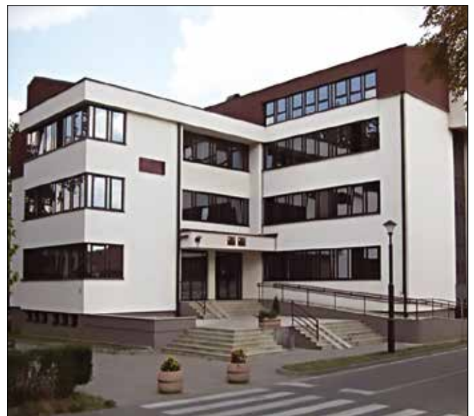
Општина Модрича – спонзор конкурса