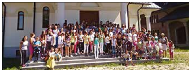
Дјеца са Косова на Дугој њиви

ла и трошкове превоза. Општина Модрича и у 2017. години учествује у овом пројекту.