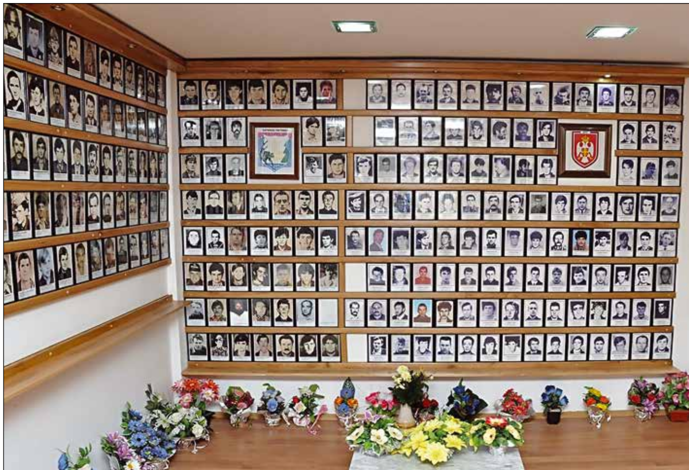
Погинули борци Гостовићког батаљона (50 фотографија, недостаје једна) и Погинули борци у другим јединицама Војске Републике Српске, Војске Републике Српске Крајине и јединицама српске полиције (111 фотографија, недостаје седам)