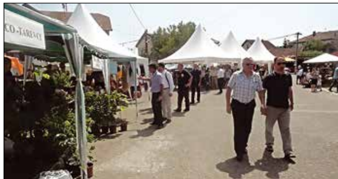
Са Сајма у Таревцима

„4Т“ и Удружење жена Модриче. Генерални покровитељ је било Министарство трговине и туризма РС, а спонзори Министарство околиша и туризма Федерације БиХ, Влада ТК и Министарство пољопривреде, шумарства и водопривреде РС.