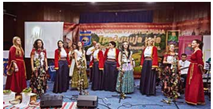
Са концерта Етно групе „Траг“ и Етно групе „Вида“ у оквиру Сајма рукотворина „Традиција и ја“

Своје рукотворине на сајму је представило 38 излагача из Бања Луке, Брчког, Шамца, Дервенте, Бијељине и града домаћина са циљем презентације својих производа купцима и широј јавности. Као и претходних година сајам је имао продајни карактер, а могли су се наћи различити предмети израђени од вуне, стакла, конца, прућа, дрвета и других природних материјала. Првог дана сајма одржана је едукативна радионица „Пирографија и израда икона“, као и округли сто на тему „Стари занати“. Другог дана одржан је концерт на коме су наступиле Етно група „Траг“ и модричка Етно група „Вида“. Чланови групе „Траг“ први пут су наступили пред публиком у Модричи представљајући свој репертоар за који су нагласили да се састоји од старих пјесама представљених на нови начин у извођењу шест инструменталиста и четри женска вокала.