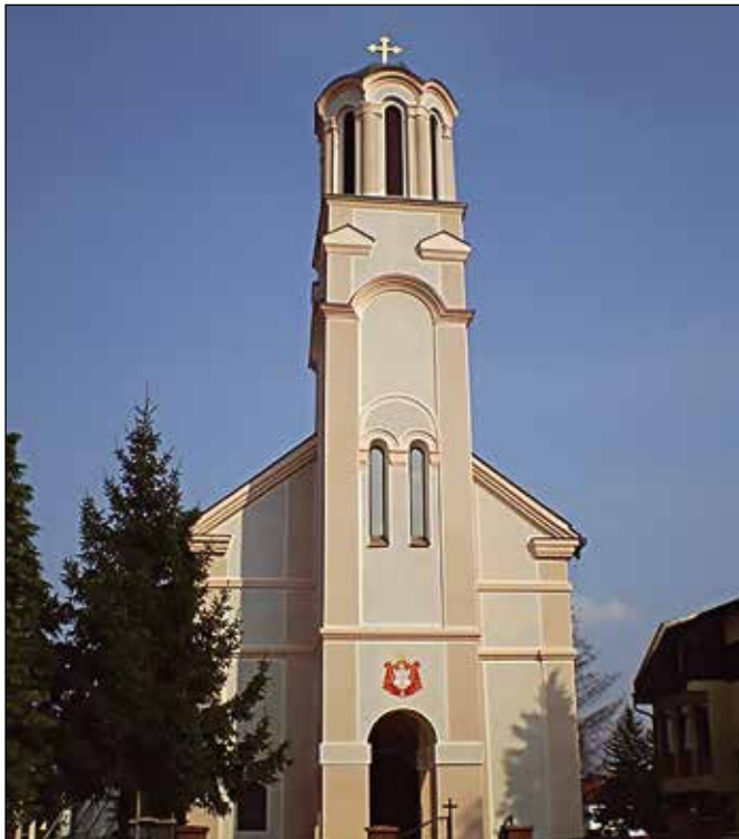
Црква у Модричи – покровитељ конкурса

Након селекције у школама радове је прегледао жири и прво констатовао да сви радови испуњавају тематске, техничке и временске услове, а потом доноси одлуку о додјели признања „Косовски божур“: