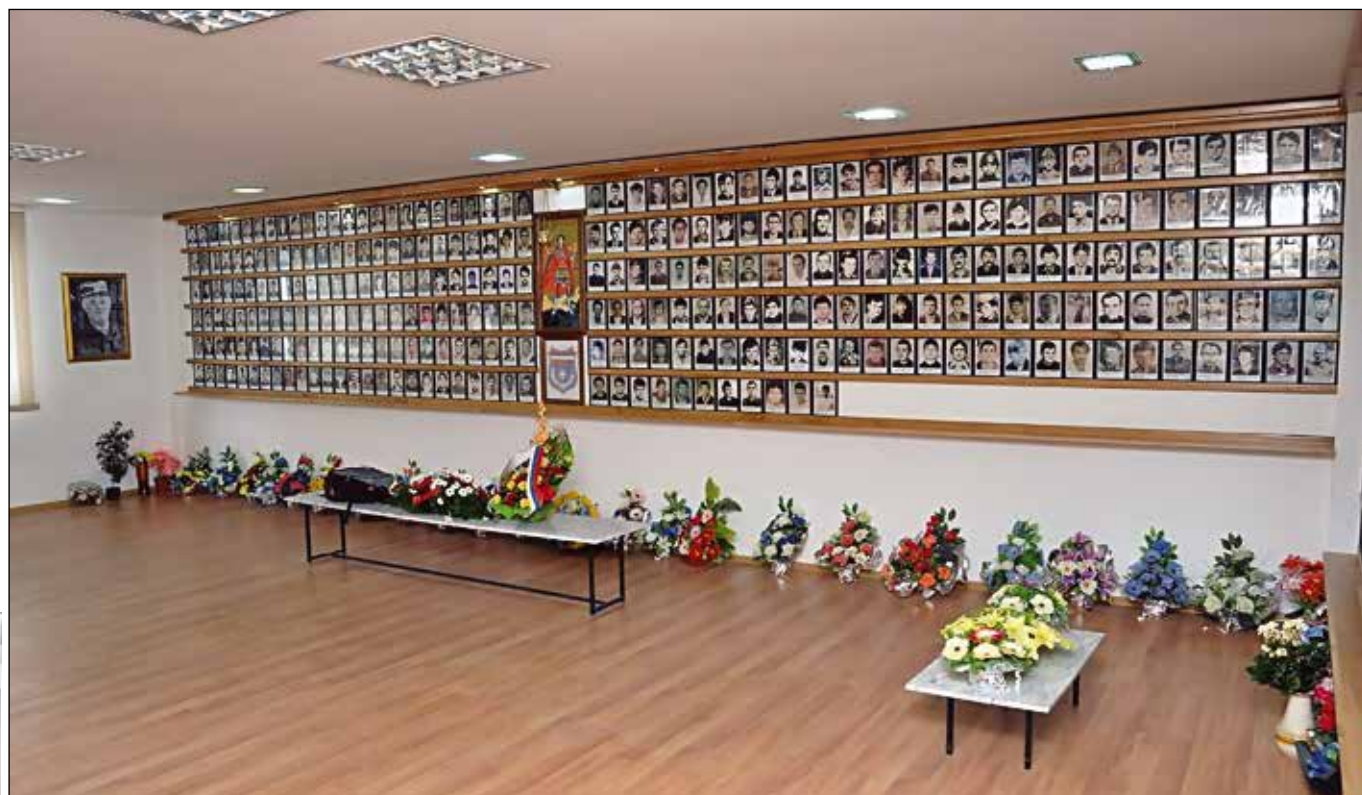
Погинули борци Требавске бригаде (301 фотографија, недостаје 11)