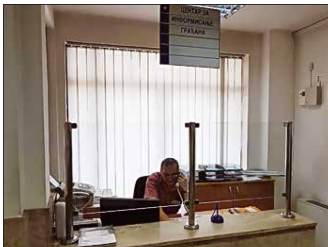
Центар за информисање у служби грађана

Одјељење за пријемну канцеларију и информисање је ново Одјељење које је основано на основу Одлуке о измјенама и допунама Одлуке о оснивању Општинске управе Модрича, а коју доноси начелник општине Модрича. Одјељење је почело са радом 1. јануара 2017. године, а до тада је било у саставу Одјељења опште управе. Надлежности Одјељења за пријемну канцеларију и информисање су бројне и углавном се односе на задовољавање потреба грађана и остваривање њихових права по различитим основама. У оквиру Одјељења ради Центар за информисање, Матична канцеларија и Шалтер сала који представљају централно мјесто на које се грађани обраћају општинској администрацији ради добијања информација, подношења захтјева за остваривање права и извршавање обавеза у управном поступку, ради издавања извода и увјерења из јавних регистра, овјере потписа, преписа и рукописа, попуњавања радних књижица, преузимање ријешених предмета, образаца, пуномоћи, уговора и изјава.