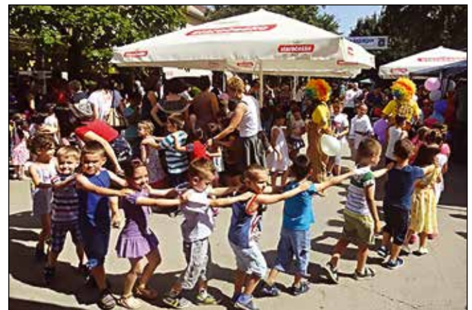
Дјечије коло на градском тргу