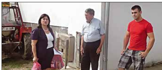
У посјети једној од породица погинулих бораца

Поводом Видовдана, Дана општине Модрича, представници Општинске управе и општинске Борачке организације још од 2005. године обилазе породице погинулих бораца и РВИ I категорије, као и породице са посебним мјесечним примањима. Сваке године за ове породице припреме се и скромни поклон пакети. У 2016. години поводом Дана општине представници локалне управе обишли су 365 породица, од којих су 342 породице погинулих бораца, 13 породица са посебним мјесечним примањима и 10 РВИ I категорије. Поред обилазака поводом Дана општине ове категорије становништва обилазе се и поводом божићних и васкршњих празника.