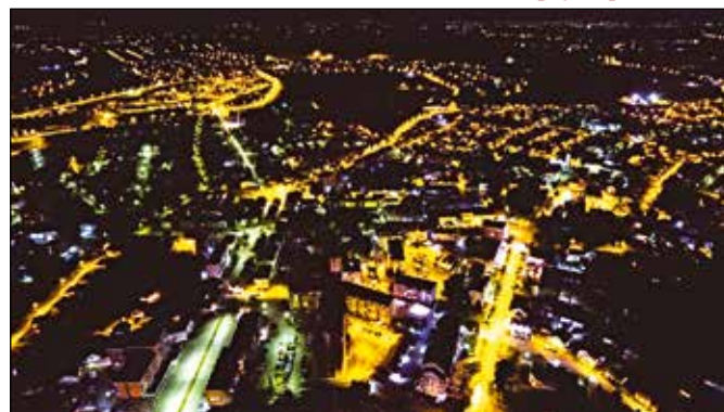
Модрича ноћу – још квалитетнија улична расвјета