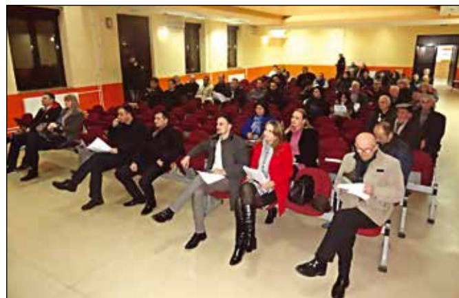
Са Јавне расправе о буџету