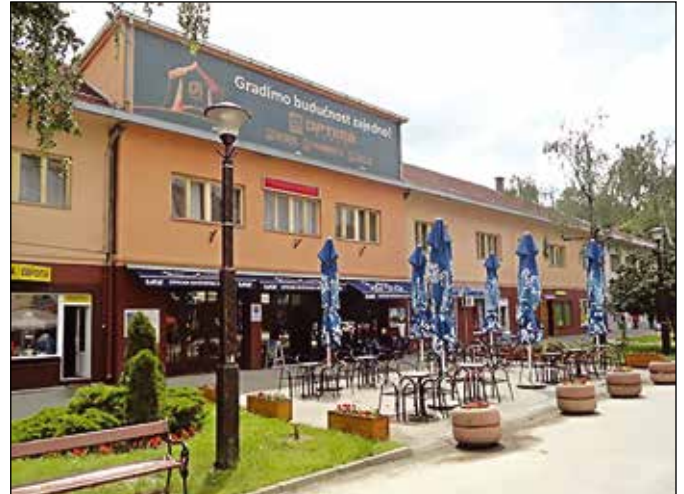
Српски културни центар – реализатор конкурса