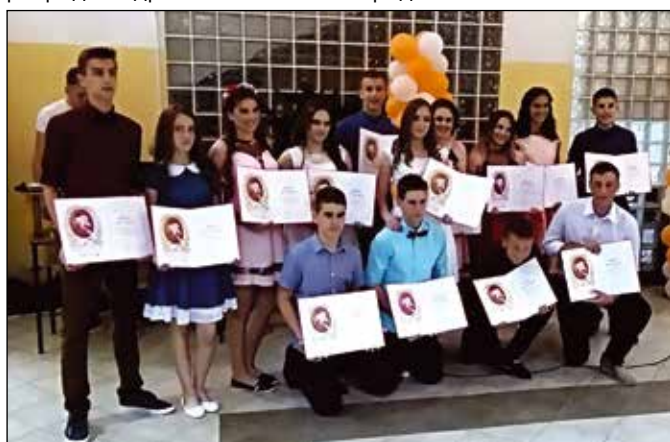
Вуковци из Основне школе „Сутјеска“

Дипломе Вук Стефановић Караџић се додјељују ученицима основних и средњих школа који су за вријеме основношколског или средњошколског образовања у свим разредима и из свих предмета имали одличан успјех и примјерно владање. Само ти ученици знају колико је за такав успјех требало концентрације на часовима, учења код куће, колико је страница требало прочитати и колико задатака ријешити, како бити одличан и примјеран свих девет односно четири године, како се не опустити никада и ни на један тренутак. Зато ти ученици заслужују наше поштовање и посебна признања. Очекивати је од њих да тако исто буду и успјешни студенти и да буду они ти који ће касније бити главни носиоци нашег привредног и уопште друштвеног развоја. На завршетку школске 2016/2017. године Диплому Вук Стефановић Караџић добило је укупно 25 ученика завршних разреда модричких основних и средњих школа.