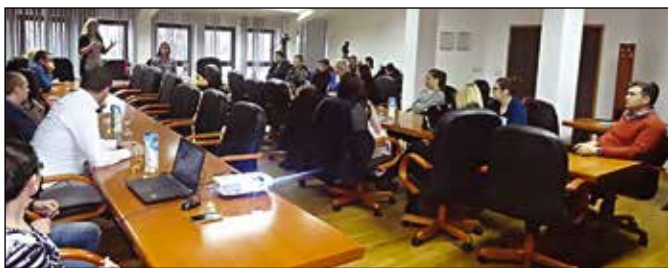
О програмима Омладинске банке

Путем Омладинске банке уз подршку Фондације „Мозаик“ и општине Модрича у току 2016. године успјешно је