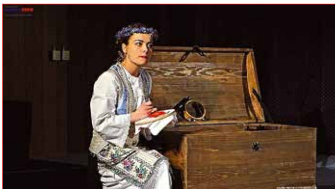
Сцена из монодраме Косово о чудеса небеских судбина

И позоришни живот у Модричи добија на замаху, сваке године је све богатији, садржајнији, квалитетнији и организованији. Између два Видовдана (2016. и 2017.) у Српском културном центру је приказано шеснаест позоришних пред-