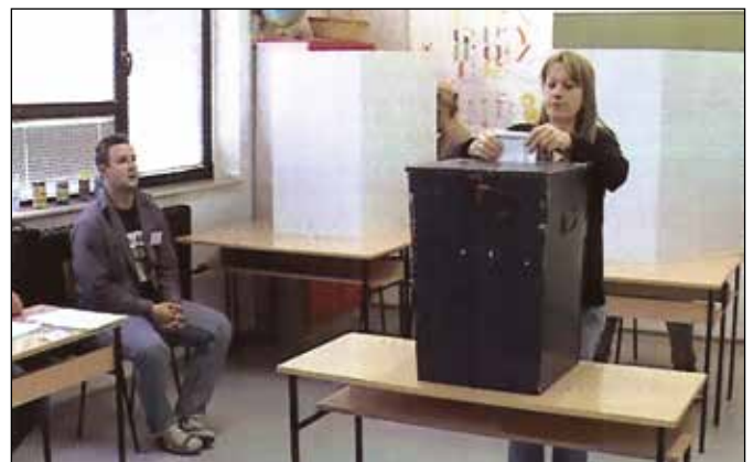
Са једног од бирачких мјеста

14. Еколошка партија Републике Српске: 2 гласа или 0,01% или 0 мандата