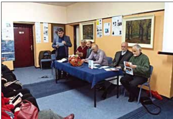
Са једне од књижевних вечери