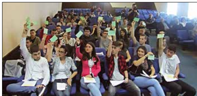
Изјашњавање на Омладинском парламенту

разговарао са ученицима о питањима која се тичу локалне заједнице и младих.