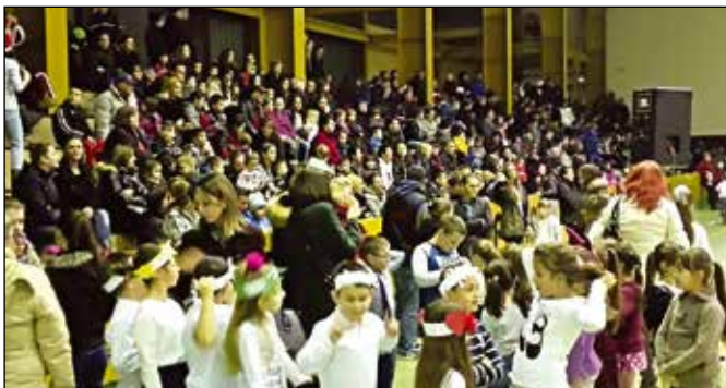
Дјечија Нова година – препуна дворана, разноврстан програм и богати пакетићи

Традиционално и ове године општина Модрича и Српски културни центар у сарадњи са привредницима са подручја општине су организовали манифеста-