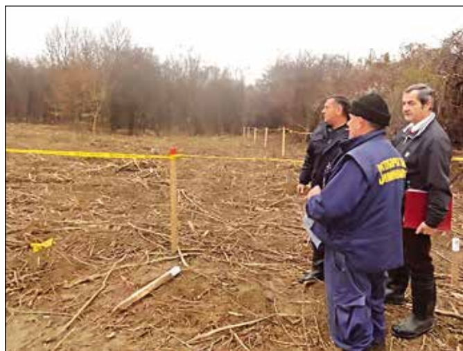
Деминери – све више за грађане безбједних површина