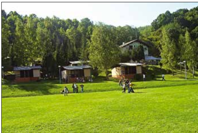
Спортски центар у Ријечанима Горњим

Јавна установа Туристичка организација „Модрича“ општине Модрича почела је са радом 2008. године са циљем промоције туристичког производа и побољшања туристичке понуде, као и унапређења и промоције изворних вриједности, како би се употпунили туристички и културни садржаји у Модричи. У свом програму рада садржи активности организовања манифестација као што су Гастро сусрети, Сајам рукотворина Традиција и ја, обиљежавање Свјетског дана животне средине, Изложба дигиталне фотографије. „Једна од значајнијих манифестација је Модричко љето , која има све већи значај. Циљ манифестације је да се повећају и употпуне културна, забавна и спортска дешавања у љетном периоду.