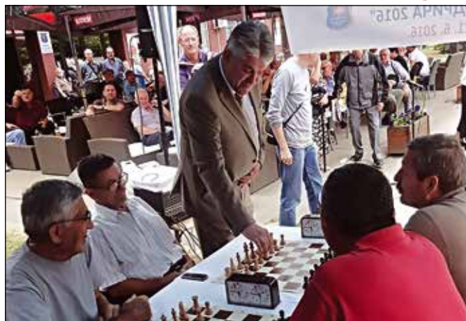
Шаховски турнир пензионера