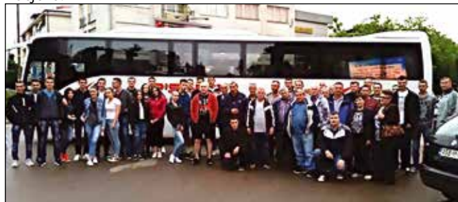
Одлазак пољопривредника на Међународни сајам пољопривреде у Нови Сад

укључена у овај вид едукације, јер је пожељно да ученици, уколико се у будућности буду бавили пољопривредном дјелатношћу, прате развој нових технологија. Пољопривредници су исказали задовољство посјетом, а општинска управа ће настојати да и у будућем периоду организује сличне посјете.