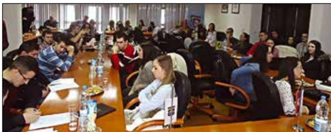
Студенти потписују уговоре о стипендијама

У школској 2016/2017. години из буџета општине Модрича стипендирају се 193 студента, од којих 133 право на сти-