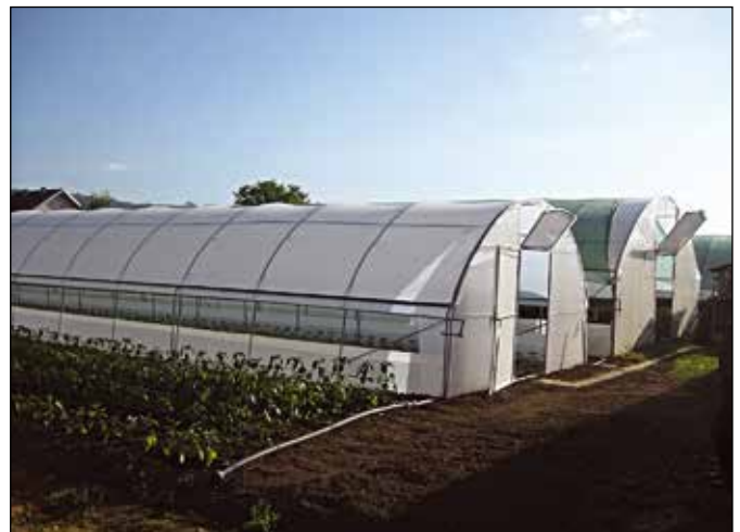
Развој пластеничке производње