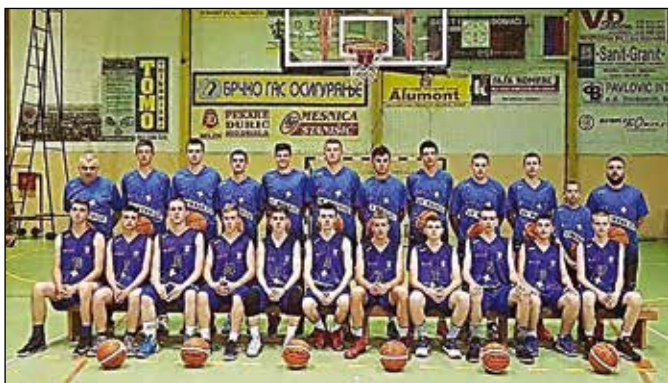
Модрички кошаркаши у сталном успону

Након потпуног опоравка модричке одбојке, замајац ка новим подвизима хватају кошаркаши. Данас Модричани нису у врху Српске у кошарци, као некада, али све се чини да се поврати стари сјај. „У посљедње двије године,