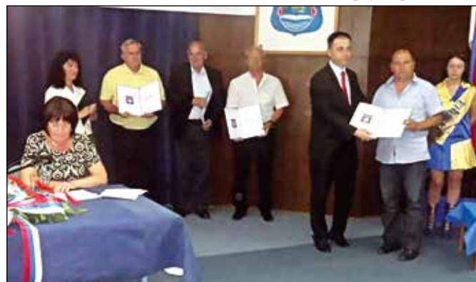
Добитници Видовданских диплома