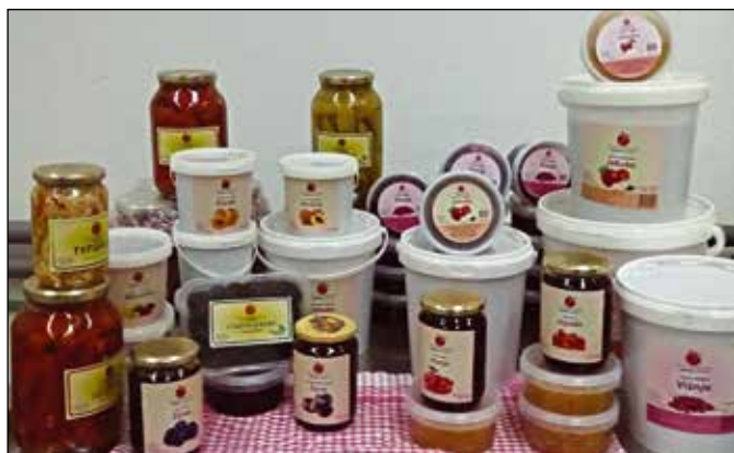
Из производног програма Предузетничког центра „Јабучик“

Уз подршку средстава ЕУ и Инвестиционо-развојне банке РС реконструисани су војни објекти и формиран Предузетнички центар „Јабучик“. Инсталисана је опрема за прераду воћа и поврћа те набављена сушара за сушење воћа и љековитог биља капацитета 1 тона / 24 сата као и хладњача капацитета 40 т. Убрзо након пуштања овог погона у рад на тржишту су се нашли производи из Јабучика: пекмези, џемови, салате, ајвар и суве шљиве. Обезбијеђена је и опрема за производњу сокова и сирупа како би се проширила понуда производа, али и кооперантска мрежа кроз субвенционисање садница малине, купине и јагоде. Реализацијом овог пројекта становништву које се бави пољопривредном производњом се омогућава пласман уз повећање прихода.