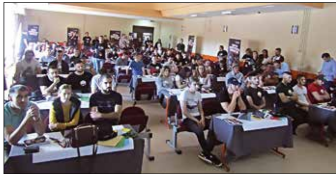
Регионални турнир друштвених иновација