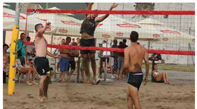
Видовдански куп у одбојци на пијеску