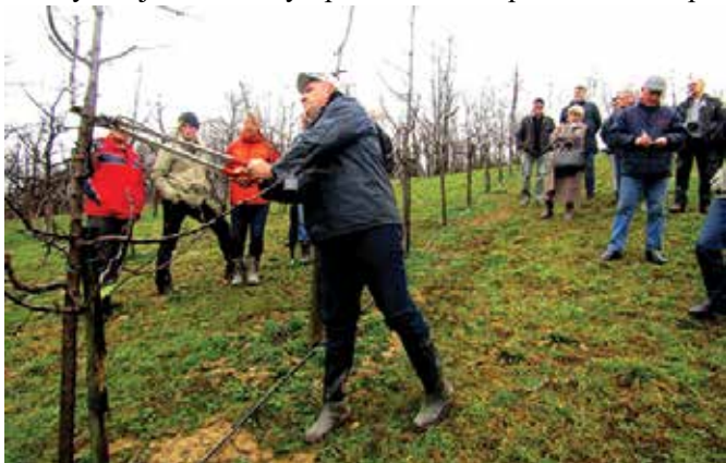
Обука у обрезивању воћа

Посебан сегмент едукације пољопривредника била је Зимска школа током које су организована стручна предавања и практична обука. Организатори сета предавања, која су почела 31. јануара 2018. године били су Одјељење за привреду и друштвене дјелатности општине Модрича и Министарство пољопривреде, шумарства и водопривреде РС – Ресор за пружање стручних услуга у пољопривреди Добој. Почетак зимске школе био је посвећен темама везаним за прозводњу нових сорти кукуруза, заштиту стрних жита, производњу, агротехнику и откуп соје. Потом су организована предавања за про-