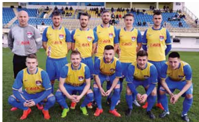
ФК „Модрича – Алфа“ – прволигаш Републике Српске