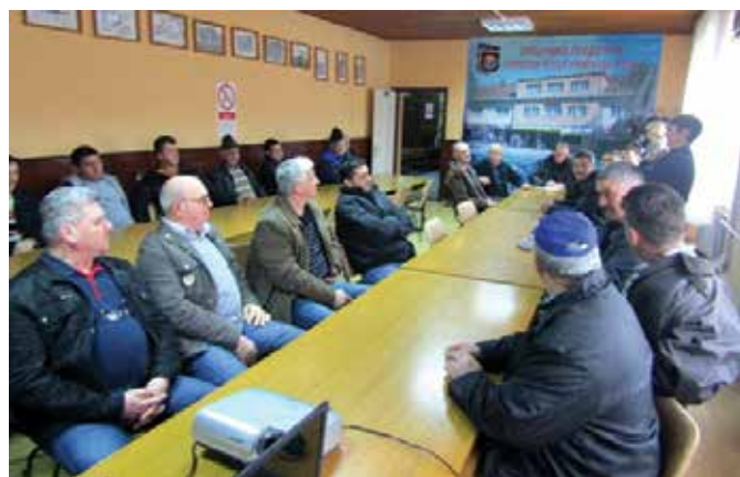
Зимска школа за пољопривредне произвођаче