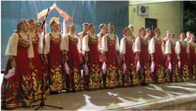
Руски фолклор у Модричи

Међу бројним културним манифестацијама које су се одржале у поводу Видовдана, Дана општине, одржан је 10. Интернационални фестивал фолклора „Дукат фест“ . Публици су се представили ансамбли „Черноземочка“ из Вороњежа у Русији и „Безонка“ и „Буринка“ из Братиславе у Словачкој. Посебне овације публике добили су чланови Черноземочке из Вороњежа, који су на српском језику отпевали пјесму „Тамо далеко“ . На Љетњој позорници СКЦ, поред гостију из Русије и Словачке, у име града домаћина наступили су чланови КУД-а „Милошевац“ из Милошевца.