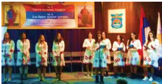
Мали фестивал велике поезије „Златна лира“

Традиционално поводом 14. фебруара, Дана Првог српског устанка и Дана Борачке организације Републике Српске, а у сусрет 15. фебруару – Срећењу Господњем и Дану државности Републике Србије Борачка организација општине Модрича уз сарадњу са Српском православном црквом, општином Модрича,