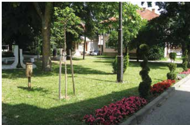
Надзор над одржавањем зелених површина