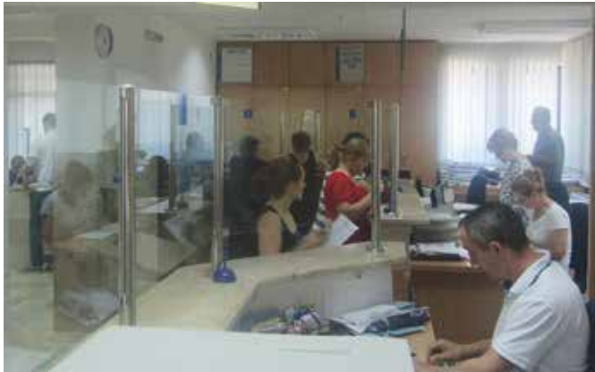
Крајње професионална услуга

Одјељење за пријемну канцеларију и информисање свој рад усмјерава на што професионалније, ефикасније и квалитетније пружање услуга свим грађанима, како би сви становници Модриче на што лакши и бржи начин остварили своја права по различитим основама. Грађани своја права могу да остваре у Центру за информисање, мјесним канцеларијама и Шалтер сали као мјестима за информисање, подношење захтјева и извршавање обавеза у управном поступку, ради издавања извода и увјерења из јавних регистара, овјере потписа, преписа и рукописа, попуњавања радних књижица, преузимање ријешених предмета, образаца, пуномоћи, уговора и изјава.