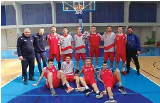
KK „Модрича“ – стални напредак

Кошаркашки спорт у Модричи има традицију дугу 46 година. У минулих годину дана пионири, кадети и јуниори