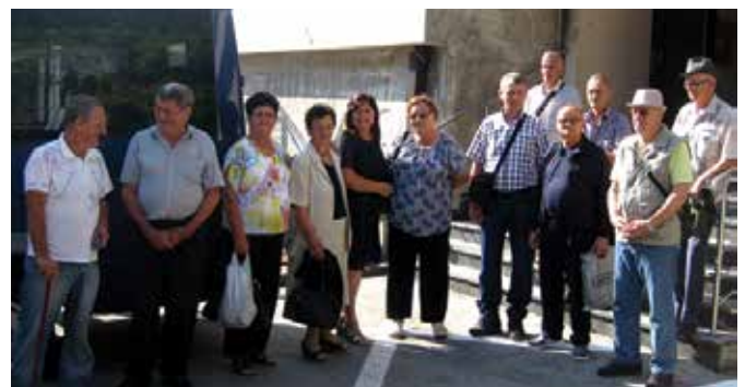
Испраћај на бањско лијечење