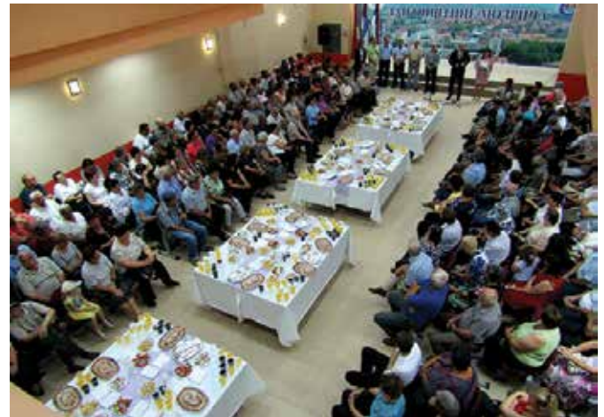
Видовдански пријем породица погинулих бораца