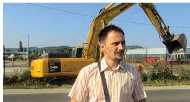
Квалитет и рокови извођења радова се морају поштовати

На 16. редовној сједници Скупштине општине усвојен је Програм капиталних улагања у 2018.години: „Укупна буџетска средства која су планирана за реализацију Програма капиталних улагања у овој години износе 380.000 марака. Издаци за изградњу зграда и објеката су 340.000, а 40.000 марака биће утрошено на инвестиционо