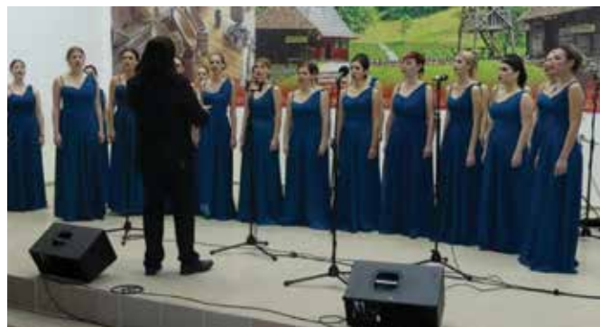
Камерни хор „Бањолучанке“ у Модричи

Десети Сајам рукотворина „Традиција и ја“ у организацији Туристичке организације општине Модрича организован је 30. новембра и 1. децембра 2017. године у Српском културном центру. Циљ манифестације је чување старих заната од заборава и преношење на млађе генерације те стварање етнолошког туристичког производа и повезивање израђивача рукотворина са потенцијалним тржиштем. Поред изложби производа од вуне, стакла, конца, прућа, дрвета и другог на којој је учествовао 41 излагач из Модриче, Бања Луке, Добоја, Теслића, Брчког, Шамца, Дервенте, Бијељине и Жупање, одржана је радионица за израду медањака и двије радионице за најмлађе. Народна пословица каже „Конац дјело краси“ у чему ријеч конац знач крај, тако је и Сајам рукотворина „Традиција и ја“ украсио концерт Камерног хор „Бањалучанке“ и Етно групе „Вида“ из Модриче. Концерт је у препуној Плавој сали Српског културног центра одржан 1. децембра 2017. године. Публика је била одушевљена љепотом етномелодија, избором пјесاما и начином њихове вокалне интерпретације