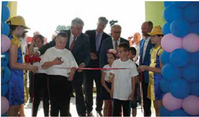
Свечано отварање нове зграде Дјечијег обданишта