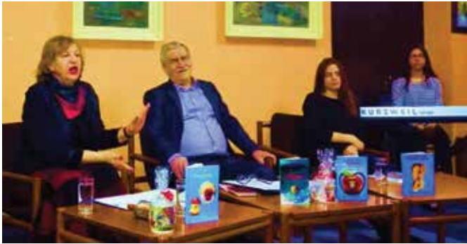
Са једне од осам књижевних вечери

Књижевно стваралаштво у Модричи се увијек његовало, а да се са посебном пажњом приступа писаној ријечи говори и велики број књижевних вечери, које су се одржале између Видовдана прошле и ове године. Одржано је осам књижевних вечери, гдје су промовисане четри књиге: свједочење о