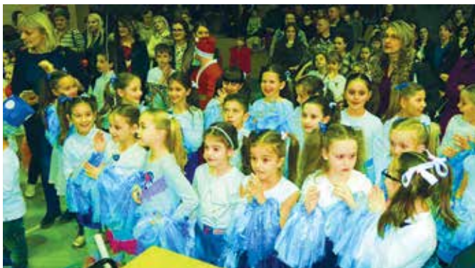
Дјечија Нова година – празник радости

Манифестација Дјечија Нова година у оквиру које се уз пригодан програм дијеле пакетићи малишанима са подручја наше општине организује се већ једанаести пут. Ове године програм је одржан 29. децембра у