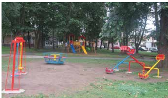
Дјечије игралиште у Градском парку