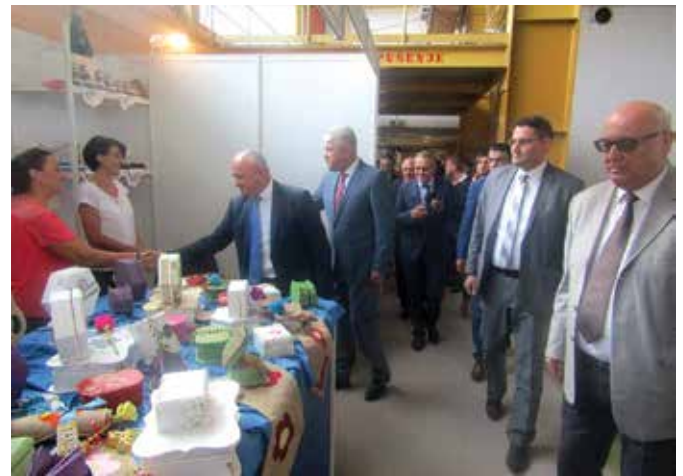
Велико интересовање за Сајам привреде