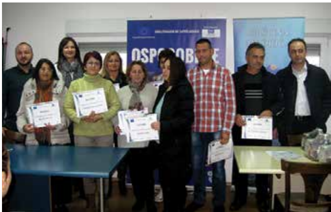
Додјела потврда о завршеној обуци

прераду воћа и поврћа, а потом кроз мали лични бизнис дошли до самозапошљавања. По завршетку обуке организовано је тестирање и практична провјера стечених знања полазника.