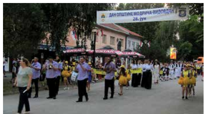
Видовдански дефиле улицама Модриче