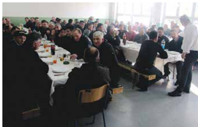
Новогодишњи пријем пољопривредника

улогу за развој и просперитет модричког краја те да су у општинској управи свјесни да се пољопривредници суочавају са различитим недаћама и проблемима, обзиром да је њихова производња често неизвјесна јер зависи од временских услова. Општина Модрича располаже са 19.823 хектара обрадивог земљишта, а сваке године се засије око 14.500 хектара. У сјетвеној структури најзаступљенији је кукуруз, стрна жита и траве, а већи дио ратарске производње се преусмјери у сточарску производњу. На подручју општине Модрича регистровано је укупно 786 пољопривредних газдинстава.