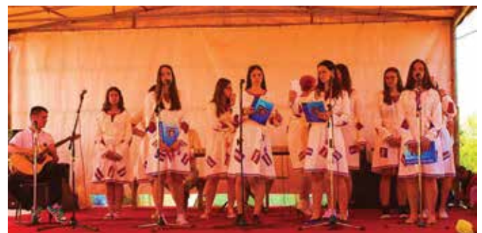
Из програма Дани Липе на Вучијаку