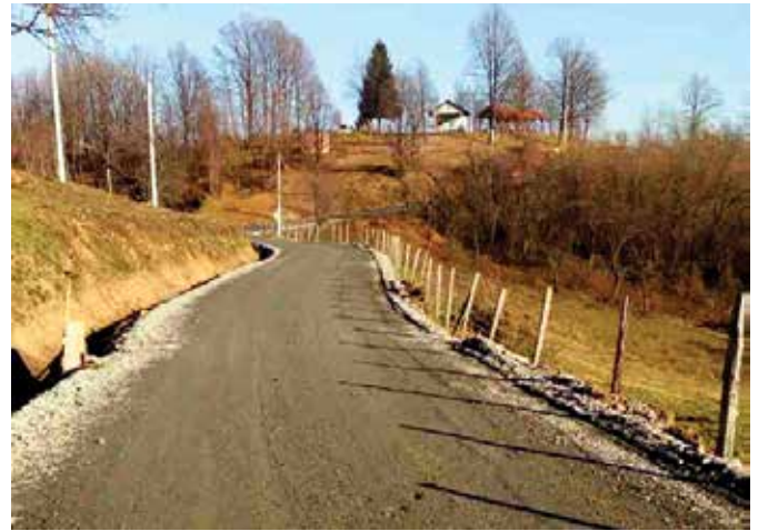
Припрема за асфалт кроз Добру Воду