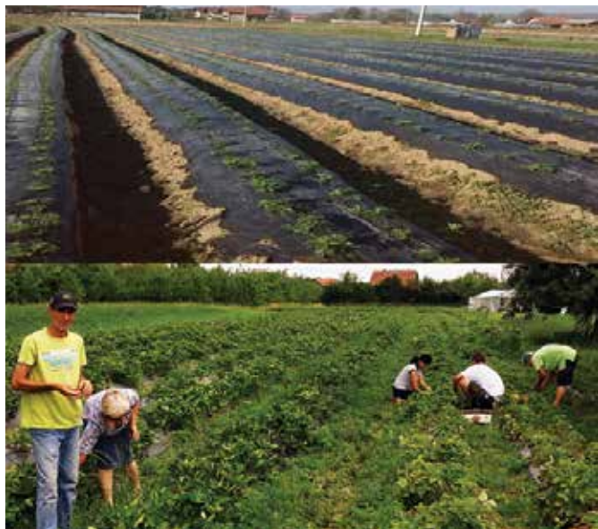
Берба јагода са нових засада