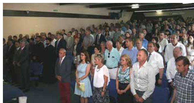
Свечана сједница Скупштине општине Модрича