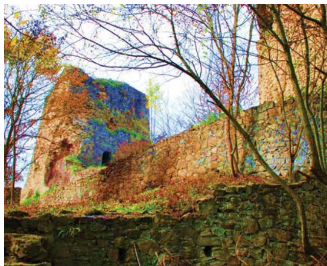
Добор кула – сјеверна капија земље Босне