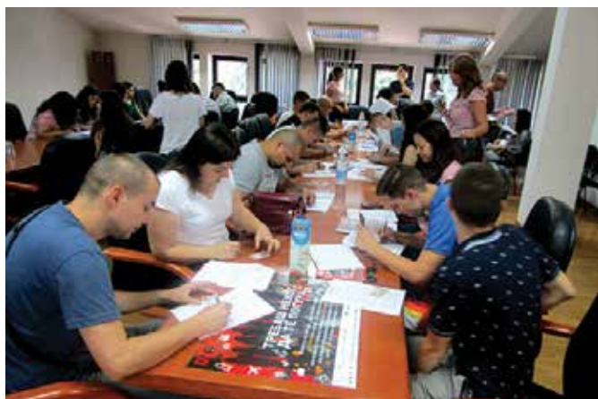
Потписивање уговора са Фондацијом „Мозаик“

Позорница пријатељства регионална је манифестација за дјецу предшколског узраста која је организована у Модричи. Окупила је 72 малишана из Брода, Шамца, Дервенте, Теслића и домаћина Модриче. Укупни побједник је обданиште “Наша радост” из Модриче. Друго место су подијелили “Трол” из Дервенте и “Палчић” из Теслића. Трећи је “Бијели анђео” из Брода, док је четврто мјесто заузело шамачко обданиште “Радост”. Током манифестације наступило је Позориште „Полетарац“ из Београда као и Културно-умјетничко друштво „Завичај“ из Модриче.