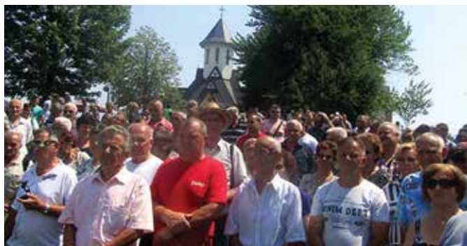
25. годишњица Пробоја Коридора живота