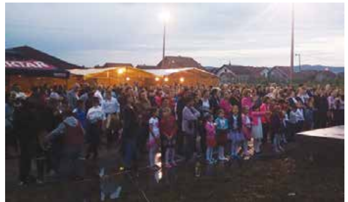
Дан МЗ Модрича 5 окупио велики број грађана