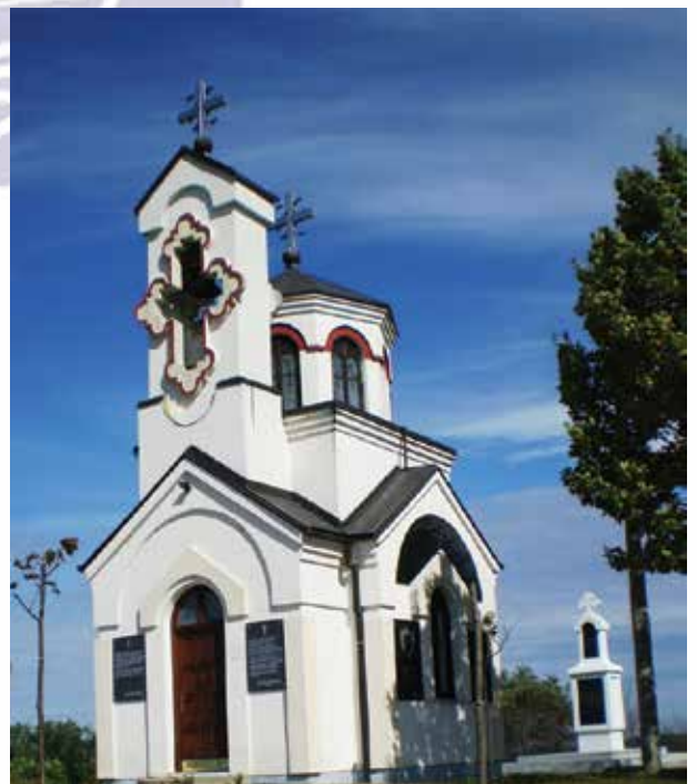
Храм Светог Јована Владимира, српског кнеза, на Липи – симбол слободе и непокора