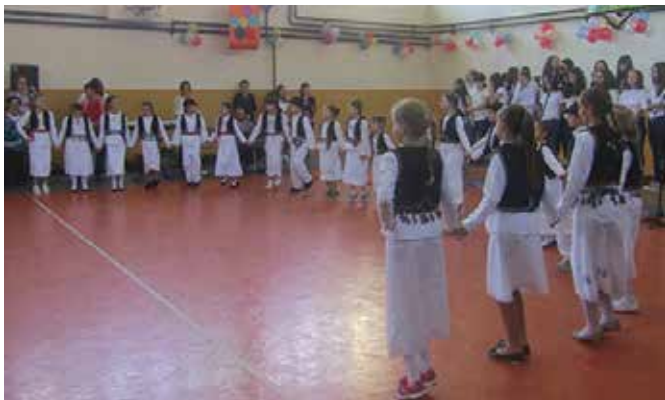
Добродошлица за првачиће од старијих другара

Кафе-сластичарница отворена је у октобру прошле године и трећи је објекат који чини једну цјелину са Дневним центром и новим објектом дјечијег вртића, за чију је изградњу финансијска средства обезбиједила швајцарска фондација „Обервалис - Дјеца нашег свијета“. Отварањем кафе-сластичарне уједно је обиљежена и друга годишњица рада Дневног центра.