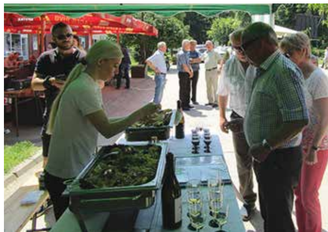
Пети Гастро сусрети

Туристичка организација општине Модрича организовала је 30. новембра и 1. децембра 2017. године 10. сајам рукотворина „Традиција и ја“ , а 11. маја 2018. године Пете Гастро сусрете „Модрича 2018“ . Сајам рукотворина је окупио 41 излагача из Модриче, Бања Луке, Добоја, Теслића, Брчког, Шамца, Дервенте, Бијељине и Жупање у Републици Хрватској. Првог дана одржана је и радионица за израду медањака, а манифестација је као и сваке године затворена концертном за грађане и учеснике сајма. Наступили су Камерни хор „Бањалучанке“ и Етно група „Вида“ из Модриче. На Гастро сусретима својим угоститељским капацитетима