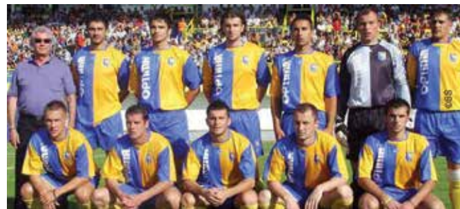
Шампионска генерација модричких фудбалера