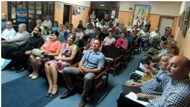
Пјесници и сликари празнику и граду