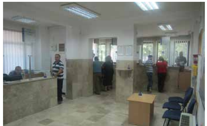
Шалтер сала у функцији грађана