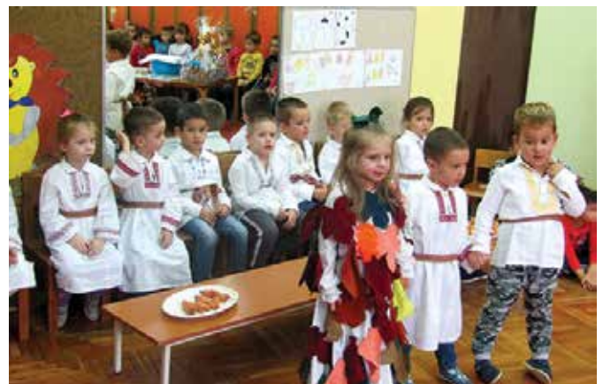
Дјечија недеља – и свечано, и традиционално, и модерно

Дјечија недеља која се обиљежава прве седмице октобра, донијела је низ садржаја. У ЈПУ „Наша радост“ пуних 12 година организују активности у циљу обиљежавања овог догађаја. Овогодишња Дјечија недеља обиљежена је под слоганом „Мој свијет – Дјечији свијет“. Овим поводом организован је низ пригодних манифестација: „Дан отворених врата“, дефиле кроз град, посјета малишана Дневном центру за дјецу са посебним потребама, музичке, ликовне и спортске активности. Начелник општине је уручио малишанима скромне поклоне. У ЈПУ „Наша радост“ борави 275 дјеце подијељених у 12 група, од чега