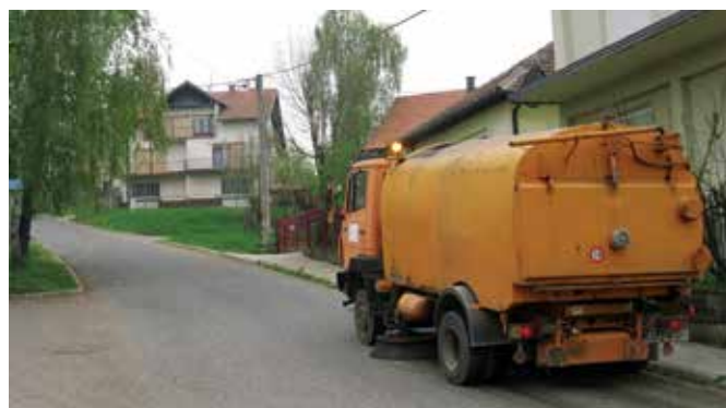
Редовно чишћење и прање улица