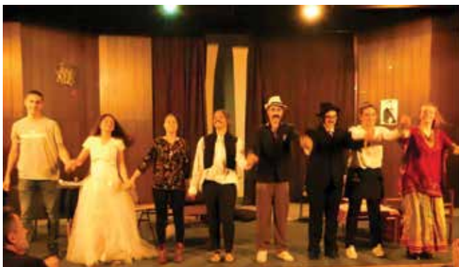
„Радован III“ у интерпретацији модричких средњошколаца