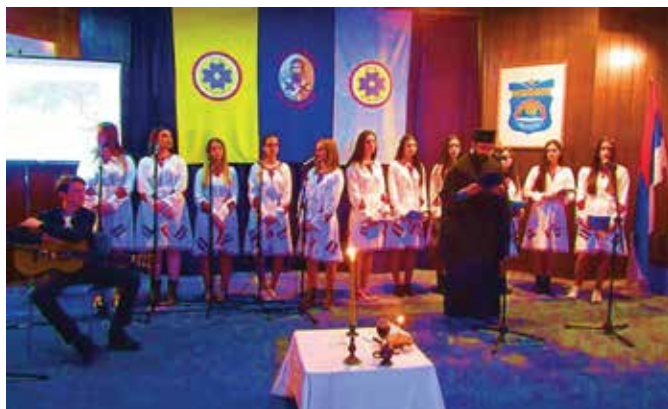
Свечана Светосавска бесједа – 26. пут

Двадесет шести пут у Модричи Српски културни центар под покровитељством општине и уз благослов цркве организовао је Светосавску академију. Академија је почела химном Боже правде и Химном Светом Сави . Свештеници са