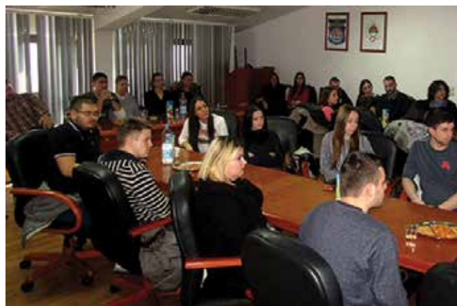
Потписивање уговора о стипендирању студената