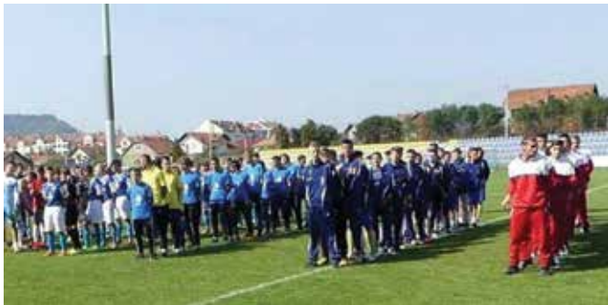
Са отварања Меморијала „Др Милан Јелић“

Кадети ОФК Београда победници су 8. Меморијала „Др Милан Јелић“ који је одржан у Модричи у знак сјећање на рано преминулог председника Републике Српске и првог човјека фудбала у Српској и у БиХ. Београђани су