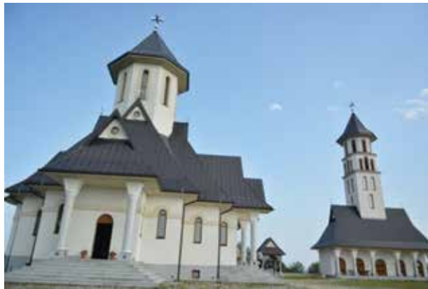
Храм Светог пророка Илије на Дугој њиви – симбол трајања народа у простору и времену

Мало је градова који имају и равницу, и ријеку, и планину. Они који имају све то троје могу с правом рећи да имају све и да им ништа не фали. Један од таквих градова је и Модрича. Пола ње је легло у житна поља Посавине, друга половина се вере по благим брежуљцима Требаве и Вучијака, а између планина и кроз равницу свјежину носи ријека Босна. Но, није то све што чини част и понос Модричанима. То су прије свега двије коте - Дуга њива на Требави и Липа на Вучијаку. То су завјетна мјеста Модричана – симболи слободе и поноса, части и непокора. То су мјеста која су се одсутно бранила у свим ратовима и бунама до посљедњег грама барута до задње капи крви. Ту се мјерила храброст и част, понос и пркос, оданост земљи, Богу и народу.