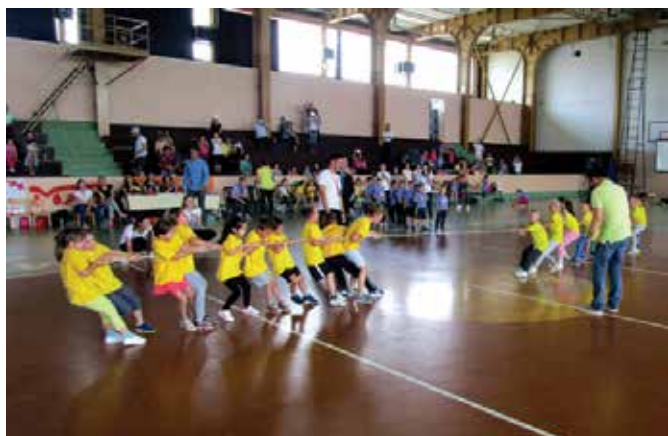
И пријатељско и витешко надметање

је 7 група смјештено у старом објекту вртића, а 5 у новоотвореном вртићу гдје бораве и дјеца са посебним потребама.