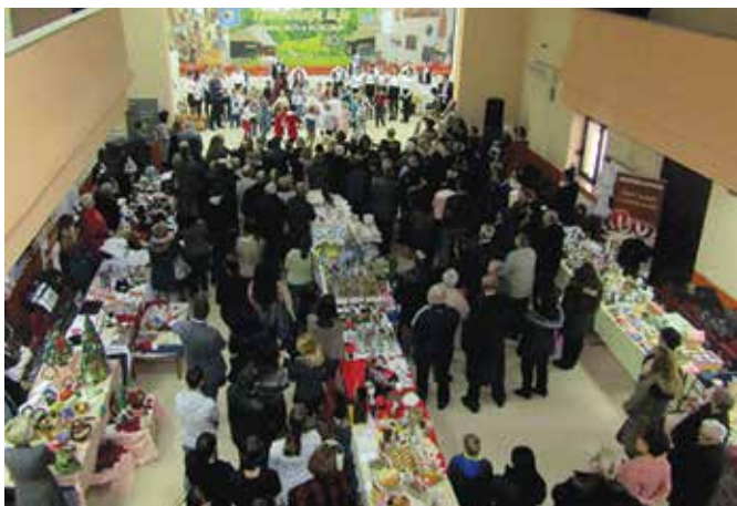
Са отварања Сајма Традиција и ја

принос развоју сајма предузећу Кврти Модрича. Организатор сајма је традиционално била Развојна агенција општине Модрича у сарадњи са модричким привредницима и Одјељењем за привреду и друштвене дјелатности општине Модрича, који имају заједнички циљ - промоцију домаћих предузећа и пољопривредника, као и промоција њихових производа и услуга.