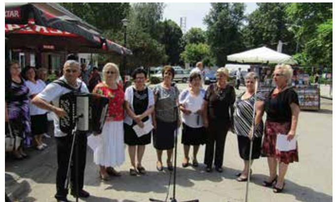
Музичка секција пензионера