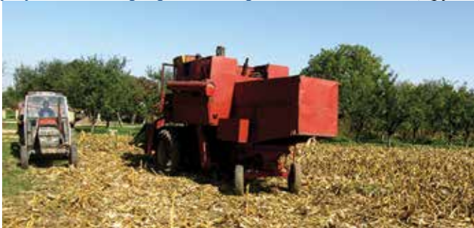
Са Дана поља кукуруза „Модрича 2017.“

Осми међународни сајам руралног стваралаштва „Таревци 2017.“ организовала је Општина пољопривредна задруга „Таревци“ од 20. до 22. јула. На сајму се представило 65 излагача из Србије, Хрватске, Федерације БиХ и Републике Српске, који су изложили домаће производе: сокове, ракију, мед и друге пчелиње производе, воће, поврће, производе од пружа и ручне радове. Традиционално, сајам је имао и едукативни карактер. Првог дана организован је округли сто на тему „Локални економски развој - стање и како га побољшати: кориштење потенцијала наше земље за производњу и прераду воћа и поврћа у аутохтоне прехранбене производе за извоз“. Другог