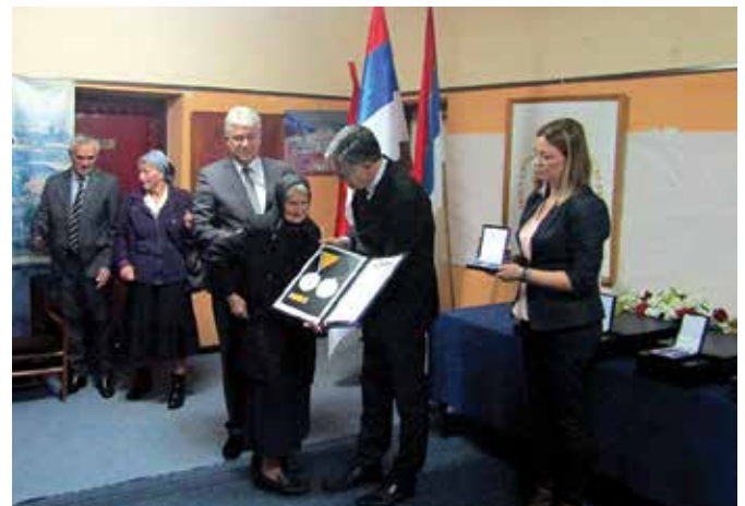
Мајка прима одликовање за погинулог сина

У периоду између два празника општине у Борачкој организацији Модриче остварили су све планиране активности. Оно на чему се посебно истрајава јесте настојање да се додатно побољша материјални положај борачких категорија. „У томе нам у највећој мјери помаже општинска управа која има разумијевања за наше потребе и захтјеве.