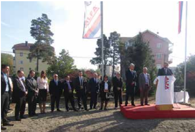
Са полагања камена темељца за нови пословни објект у ДОО Алфа