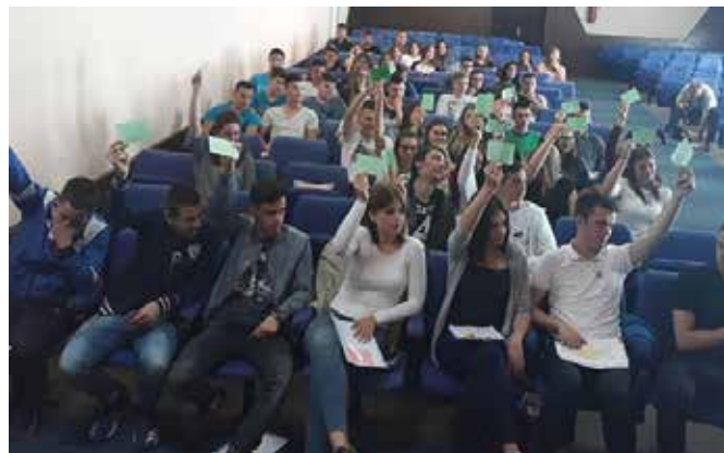
Сједница Омладинског парламента

Омладински парламент Модриче усвојио је Одлуку о одабраним малим пројектима за финансирање из општинског буџета у школској 2018/2019. години. Ријеч је о квизу „Слагалица“ и турниру у малом фудбалу и кошарци укупне вриједности 1.500 КМ. За финансирање великог пројекта из општинског буџета предложена су три пројекта. Ради се о набавци платна и пројектора, замјени крова на амфитеатру и читаоници за ученике. Изгласан је пројекат набавке платна и пројектора чиме је планирана набавка опреме како би се квалитетније одвијала настава у складу са европским стандардима, а вриједност пројекта је 4.959 КМ. Претходних година одобрено је и реализовано 39 пројеката за које је из буџета општине Модрича издвојено 77.588,68 марака.