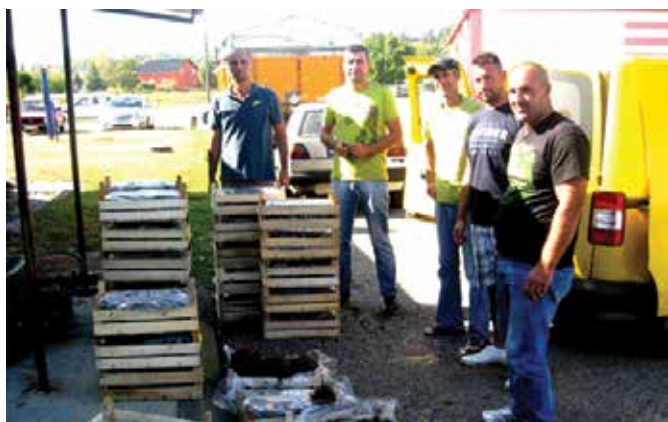
Подстицаји за воћарску производњу – подјела садног материјала

Пољопривреда је традиционално једна од најважнијих стратешких грана развоја општине Модрича, због чега се посебна пажња посвећује њеном унапређењу кроз подстицаје за различите намјене и различите видове едукације произвођача. Поред републичких подстицаја, модрички пољопривредници остварују и подстицаје из општинског буџета. По основу Јавног позива за 2017. годину до краја те календарске године исплаћено је 100 подстицаја на име подршке сточарској и биљној производњи те нових инвестиција у биљној производњи. Исплаћено је укупно 99.192,3 КМ, а од укупног броја произвођача који су остварили право на подсти-