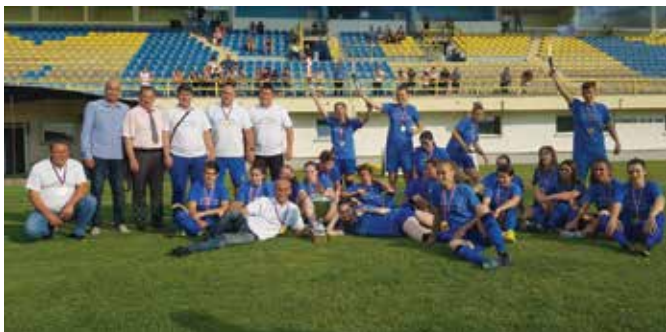
ЖФК „Модрича“ – премијерлигашице

Прошавши бараж и тријумфом против „Младости“ из Рогатице, фудбалерке Модриче су избориле Премијер лигу Босне и Херцеговине. Поставши шампионке Републике Српске, оне су по други пут од оснивања прије пет година