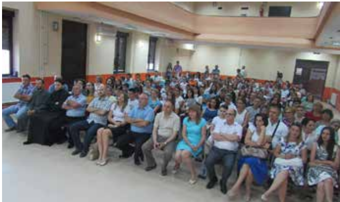
Пријем дјеце са Косова и Метохије у Модрици