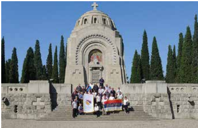
Борачка организација на Зејтинлуку у Грчкој