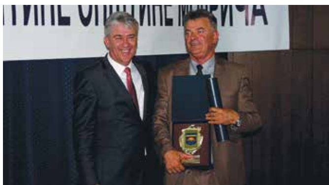
Повеља општине Одбојкашком клубу „Модрича“

Свечана сједница Скупштине општине Модрича сваке године прилика је да се поводом Дана општине, Видовдана, додијеле награде и признање најбољим ученицима, пољопривредницима, појединцима и колективима који су дали свој допринос у афирмацији општине Модрича. Као и ранијих година и у 2017. години уручене су похвале, новчане награде, дипломе, плакете и повеља као највеће општинско признање.