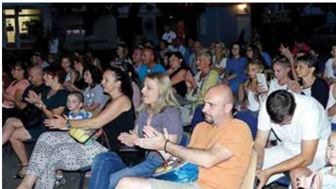
Са једне од манифестација Модричког љета 2017.

У организацији Туристичке организације општине Модрича, 7. августа отворена је манифестација „Модричко љето 2017.“, које је трајало до 11. августа 2017. године. Првог дана манифестације организован је концерт