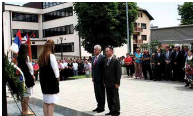
Поетски час испред Споменика борцима за РС