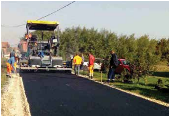
Нови асфалт у Добрињи

Добра Вода , дио мјесне заједнице Дуго Поље, добила је модеран пут. Асфалтирана је дионица у дужини од 310 метара, ширине асфалта 3,8 метара. Радове укупне вриједности 24.552,45 марака финансирао је Министарство за избјеглице и расељена лица Владе Републике Српске.