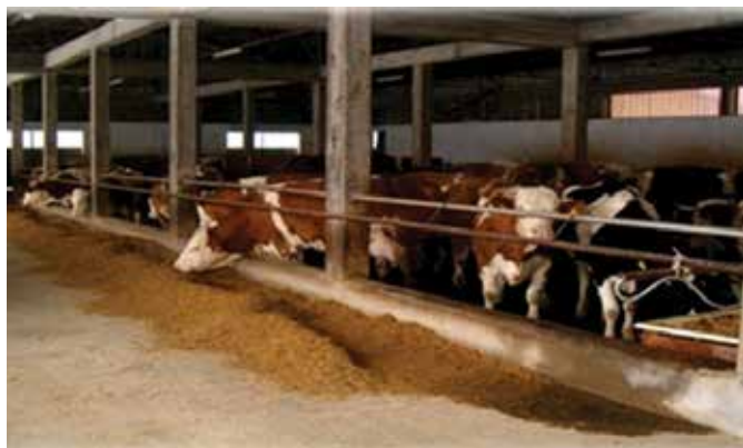
Подстицаји за сточарску производњу – фарма крава

Пољопривреда је традиционално једна од најважнијих стратешких грана развоја општине Модрича, због чега се посебна пажња посвећује њеном унапређењу кроз подстицаје за различите намјене и различите видове едукације произвођача. Поред републичких подстицаја, модрички пољопривредници остварују и подстицаје из општинског буџета. По основу Јавног позива за 2017. годину до краја те календарске године исплаћено је 100 подстицаја на име подршке сточарској и биљној производњи те нових инвестиција у биљној производњи. Исплаћено је укупно 99.192,3 КМ, а од укупног броја произвођача који су остварили право на подсти-