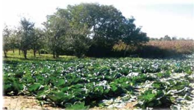
Подстицаји за производњу поврћа – засад купуса

Кроз пројекат „ Локални интегрисани развој “ који представља трогодишњу иницијативу финансирану од стране ЕУ, а који проводи Развојни програм Уједињених нација у БиХ у 2017. години путем Јавног позива расписаног за кориснике из девет општина у БиХ, из Модриче су одабрана три корисника којима су обезбијеђене саднице јагоде, трешње и љешника, пакети прихране и заштите, као и системи за наводњавање. Путем истог пројекта 26. априла 2018. године потписани су уговори и подијељен сјеменски материјал за девет корисника који су подржани за подизање и проширење засада соје. Поред додјеле генетски немодификованог сјемена соје, обезбијеђена је и стручна обука за производњу соје од стране пројекта ЛИР. Општина Модрича заједно са УНДП као партнером