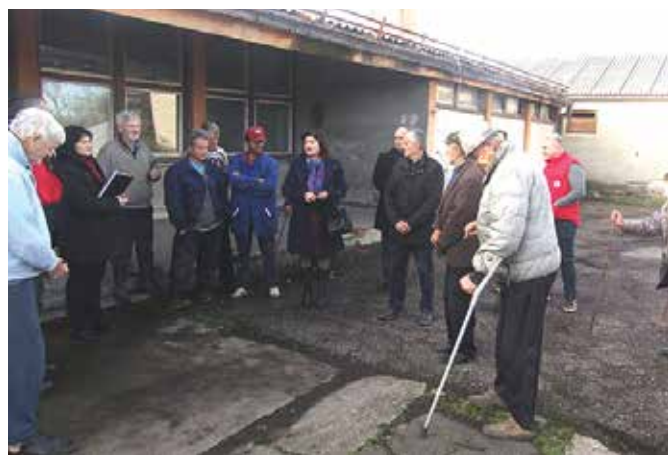
Посјета Колективном центру Кладари Доњи

коју им поклањају сваке године пред божићне и васкршње празника доста значи за кориснике центра јер захваљујући поклон пакетима које добију могу празнике дочекати колико толико свечано. За све кориснике Колективног центра у току је трајно рјешавање стамбеног питања. Изградња 22 стамбене јединице је у току и у њима ће бити смјештена 22 самца, од чега дванаест из Колективног центра и десет из социјално угрожених категорија.