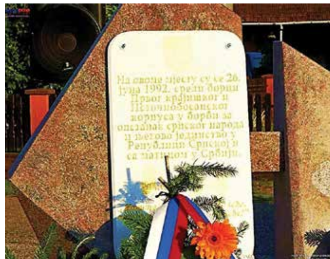
Да се никада не заборави

У стиховима Филипа Вишњића, Алексе Шантића, Јована Дучића, Скендера Куленовића... у приповиједању Светозара Ђоровића, Петра Кочића, Иве Андрића, Бранка Ћопића, Меше Селимовића... и још много, много прије свега овога, за шта тек сада прикупљамо доказе које су силни и похлепни немилосрдно уништавали да би ово могли прогласити својим. Дубоки су и јаки коријени Републике Српске да би је неки од јуче проглашени народом и они други од прекјуче могли ишчупати из коријена. Маните се ћорави посла, нисмо ми овдје од јуче, нисмо ми народ по жељама оних из Ватикана или Инстабула, већ по поријеклу и историјском трајању и пустите нас да на миру живимо свој живот, да га организујемо и уређујемо по својој жељи и мјери као што и ми вас пуштамо да живите и радите шта хоћете и како хоћете, само не на штету Срба и Републике Српске, тога је доста било, било га је и превише.