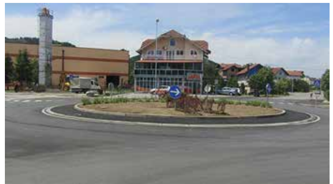
Кружни ток на укрштању Доситејево и Принципове улице

уличном баскету , у организацији КК „Модрича“. Као и свих претходних година, турнир је привукао велику пажњу како учесника, тако и љубитеља кошарке. На турниру је учествовало шест пионирских екипа, дванаест јуниорских, десет кадетских и шеснаест екипа у конкуренцији сениор и то из Бања Луке, Добоја, Лакташа, Теслића, Какња, Дервенте, Шамца, Оџака, Добоја и Модриче. Код пионира прво мјесто освојила је екипа Коноба „Воденица“ Модрича , у категорији кадета екипа „Klub Underground“ такође из Модриче, у категорији јуниора екипи „Caffe Street“ Модрича , а у сениорској конкуренцији најбоља је била екипа „Sport caffe“ из Лакташа .