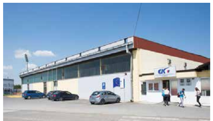
Реконструкција Спортске дворане

У области пољопривреде Одјељење за привреду и друштвене дјелатности прије свега пружа стручну подршку пољопривредним произвођачима, а велику улогу има и у