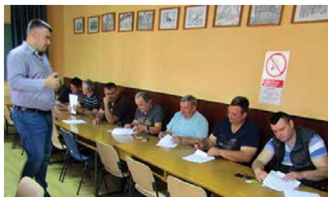
Потписивање уговора - подстицаји за производњу соје

Подршка општине пољопривредницима модричког краја огледала се и кроз различите видове едукација. Једна од њих је била обука за прераду воћа и поврћа у Предузетничко-едукационом центру „Јабучик“. Обуку је водио Центар за промоцију европских вриједности ЕУРОПЛУС, који је је потом 16. новембра 2017. године уручио потврде о оспособљавању за десет незапослених лица за самосталну прераду и паковање воћа и поврћа. Општина Модрича се укључила и у ову активност, како би заинтересована лица стекла одређена знања за