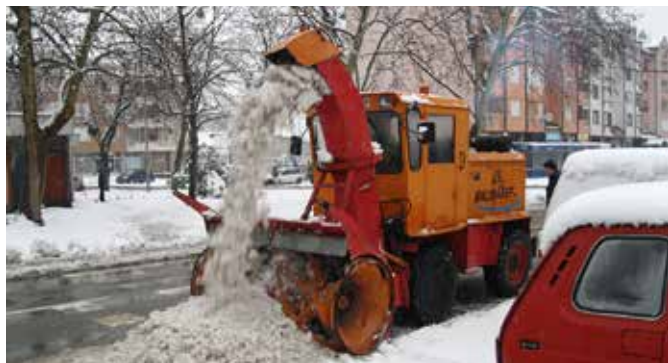
Машине за чишћење снијега – поклон од пријатеља

одржавање и реконструкцију зграда и објеката. Планирамо асфалтирати крак улице Цара Лазара у Модричи 2, улице Ђуре Ђаковића и Новосадску у истој мјесној заједници. У Модричи 3 очекује нас асфалтирање Београдске, Крајишке и Омладинске улице. Планирано је и асфалтирање дијела локалног пута Симићи - Којићи у Ботајици, па локалног пута у Јоховој Бари у Боровом Пољу. Биће завршена улица 3 у Добрињи. Асфалтираће се путеви у Бријестову у МЗ Врањак, Теофиловићи у МЗ Дуго Поље, путева Божићи и Куновац у Толиси, пут у Крчевљанима, паркинг код гробља у Милошевцу.“