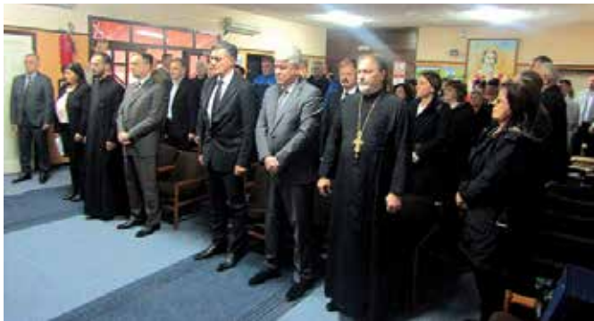
Са додјеле одликовања породицама погинулих бораца