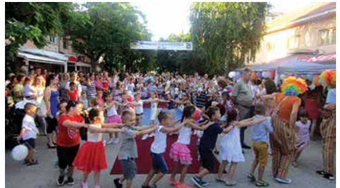
Весело на Конференцији беба