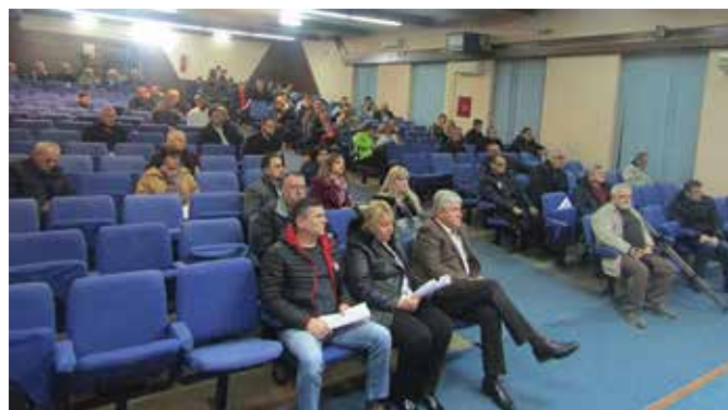
Са Јавне расправе о буџету