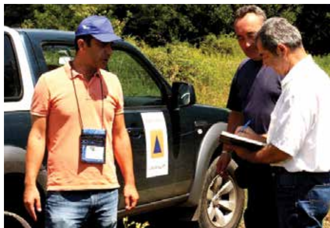
На терену са демнирима

Током 2017. године наставило се са пословима демнирања . Завршена су два пројекат Видићка чија је површина 14.091 метара квадратних и Пружни појас Кладари Доњи - Милошевац површине 1.716 метара квадратних, док је трећи пројекат Полој - ловачка кућа површине 12.022 метара квадратних започет у октобру, али због временских услова није завршен. Завршетак демнирања на овом подручју планира се у току 2018. године. Поред демнирања рађене су и активности регистрације и уклањања неексплодираних убојних средстава. Уклоњено је 200 неексплодираних убојних средстава, 2.910 комада муниције и 10 метара спорогорећег штапина.