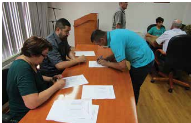
Подјела накнада за уибенике дјеци из ППБ и РВИ

Министарство рада и борачко - инвалидске заштите РС Пројектом бањске рехабилитације ратних војних инвалида и чланова породица погинулих бораца Одбрамбено - отаџбинског рата за 2017. годину предвидјело је рехабилитацију 568 лица из РС у неколико бањско-климатских здравствених установа. У оквиру овог пројекта 13 лица из Модриче упућено је на бањско лијечење у Бању Врућицу код Теслића и то седам чланова породица погинулих бораца и шест ратних војних инвалида.