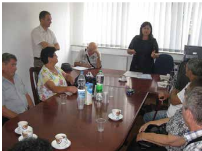
Испраћај чланова ППБ и РВИ на бањско лијечење

Министарство рада и борачко - инвалидске заштите РС Пројектом бањске рехабилитације ратних војних инвалида и чланова породица погинулих бораца Одбрамбено - отаџбинског рата за 2017. годину предвидјело је рехабилитацију 568 лица из РС у неколико бањско-климатских здравствених установа. У оквиру овог пројекта 13 лица из Модриче упућено је на бањско лијечење у Бању Врућицу код Теслића и то седам чланова породица погинулих бораца и шест ратних војних инвалида.