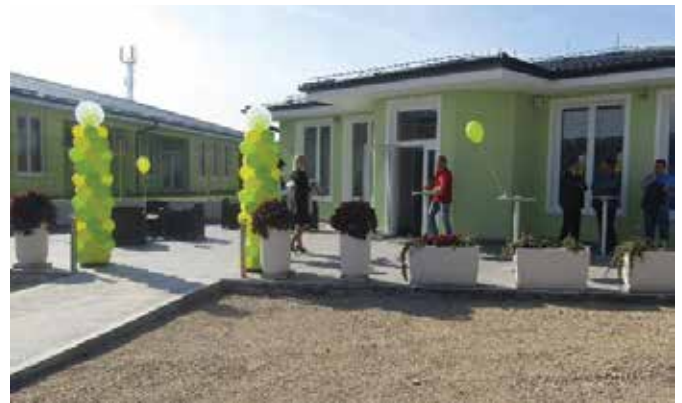
Кафе-сластичарница спремна за отварање