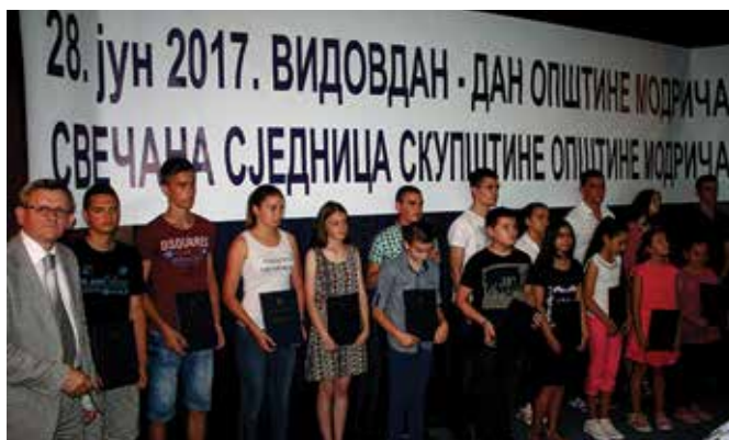
Најмлађи добитници Видовданских признања

Записе о добитницима признања и награда поводом Дана општине из техничких разлога увијек објављујемо ретроактивно – 2018. за 2017. годину, а 2019. за 2018. годину, ако Бог да.