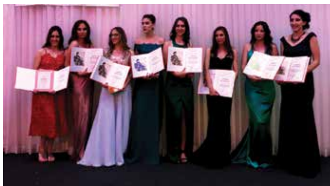
Вуковци из СШЦ „Јован Цвијић“

Због оствареног успјеха и додатних залагања на такмичењима, у школским и ваншколским актив-