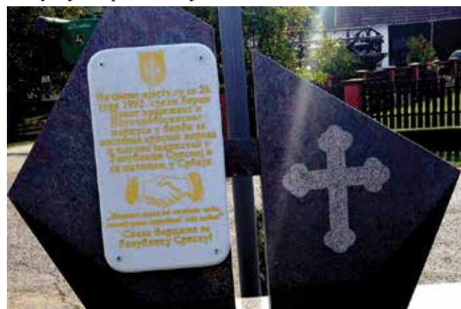
Спомен-обиљежје у Скугрићу

На сам Видовдан одржан је Поетски час испред Споменика борцима за Републику на коме су чланови Драмско-рецитаторске секције Културноумјетничког друштва Модрича казивали родољубиве стихове посвећене празнику, граду и борцима за слободу. Помен погинулим борцима служили су свештеници Српске православне цркве са подручја општине Модрича. Цвијеће су испред споменика положили представници општине Модрича, бројних институција и организација.