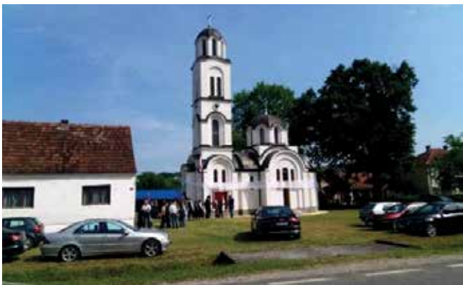
Освештање новосаграђеног храма у Кутловцу