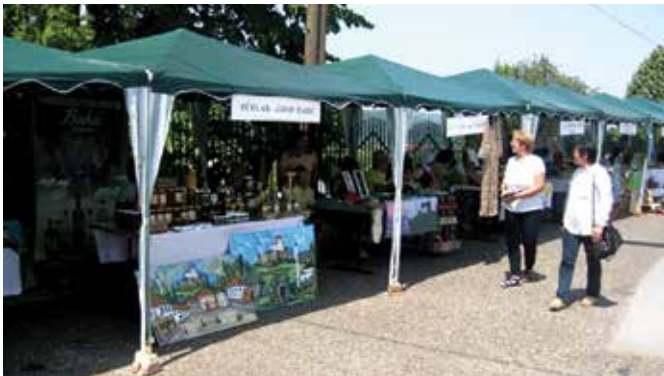
Са Сајам руралног стваралаштва „Таревци 2017.“

У периоду између два празника општине у Модричи је одржано пет сајамских манифестација и организована колективна посјета 85. међународном сајму пољопривреде у Новом Саду. Одржана је и манифестација Дани поља кукуруза.