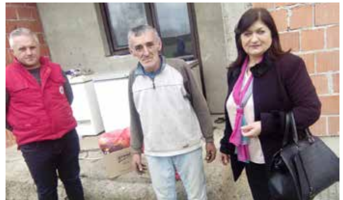
Васкришња посјета једном од бораца Војске РС

Општина Модрича посебну пажњу поклања школовању дјеце ППБ и РВИ. Дјеца ППБ и РВИ имају право на накнаду за уџбенике , накнаду за превоз, ђачке екскурзије, студентске стипендије и студентске екскурзије. Ово право остварује се по општинској Одлуци о допунским правима од 2005. године. Право на накнаду за уџбенике имају дјеца породица погинулих бораца, ратних војних инвалида од I - IV категорије инвалидности који похађају основну и средњу школу као и дјеца ратних војних инвалида од V - X категорије који имају троје и више дјеце. Накнаду од по 100 КМ је добио 51 ученик, дјеца РВИ. Дјеца ППБ и као студенти остварују право на набавку уџбеника у износу од 200 КМ, право на студентску стипендију у износу од 100 КМ и студентску екскурзију од 400 КМ.