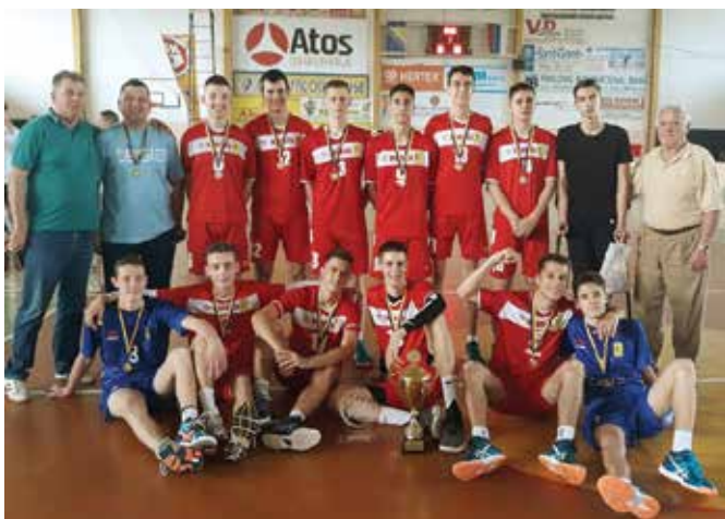
ОК „Модрича“ – стабилни премијерлигаш

Одбојкашки клуб „Модрича“ годину дана функционише као једна успјешна породица. Фузијом мушког и женског