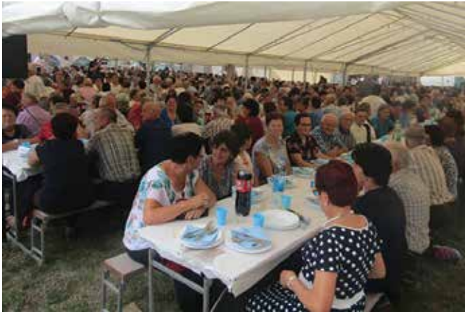
Дан пензионера – традиционално дружење у Ријечанима

У протеклих годину дана у Удружењу пензионера општине Модрича активно се радило на обезбјеђивању материјалне и социјалне сигурности за кориснике пензија, на развијању солидарности у задовољења потреба социјално угрожених пензионера и пензионера инвалида, на пружању разних видова помоћи члановима Удружења, на праћењу прописа из области пензијско-инвалидског осигурања и учешћу у друштвеном животу локалне заједнице.