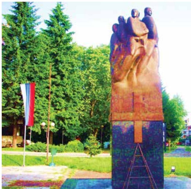
Споменик борцима за Републику Српску у Модричи