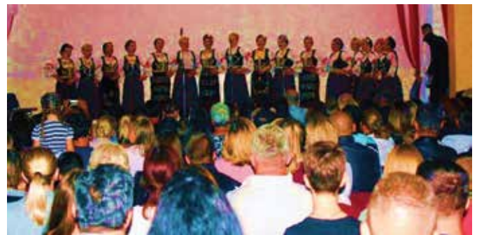
Вече фолклора у Модричи – „Срце да игра, душа да пјева“

Вече фолклора у Дугом Пољу одржано је традиционално јубиларни десети пут. Учешће су узела културноумјетничка друштва са подручја општине Модрича и вуковарскогермекске жупаније из Хрватске. У обновљеном Дому културе наступили су КУД „Боко Патковић“ из Боботе, КУД „Васо Ђурђевић“ из Бршадина, КУД „Младост“ из Крчевљана, те домаће Кул-