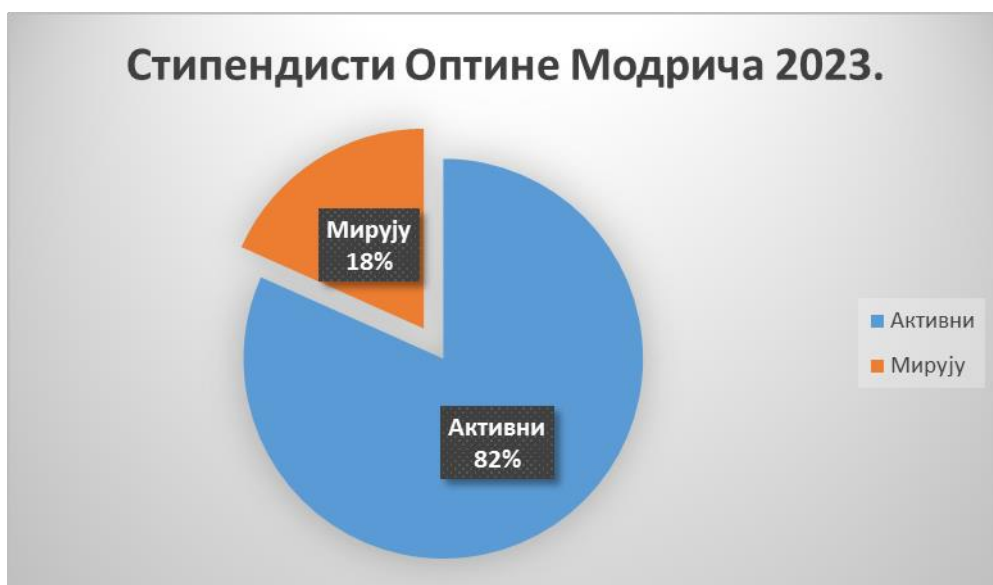
Дијаграм бр.3 Укупан број стипендиста који примају стипендију и којима иста мирује

Њихов статус у јануару 2023. године, када је исплаћена прва стипендија за академску 2022/23 годину је приказан у дијаграму бр. 3.