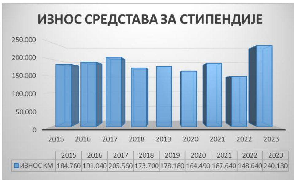
Дијаграм бр.1 Приказ издвојених финансијски средстава за исплату стипендија за период 2015-2023. година (нису урачунати стипендисти који обнављају годину)

Стипендију у 2023. години примају стипендисти који су успјешно завршили академску 2021/22 годину и стекли услов да у академској 2022/23 години упишу наредну годину студија као и студенти којим је стипендија додијељена 2023. године. Стипендију не примају стипендисти који су обновили годину, којима право на стипендију мирује као и они који су се одрекли општинске стипендије у корист стипендије коју су добили од Министарства за научнотехнолошки развој, високо образовање и информационо друштво Републике Српске као и Фонда „Др Милан Јелић“.