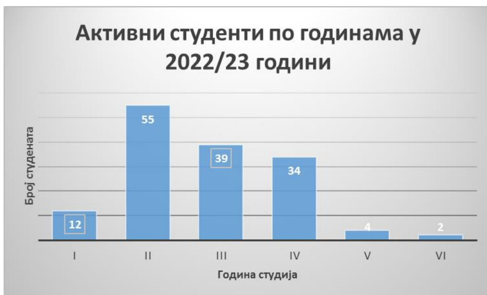
Дијаграм бр.4 Активни стипендисти Општине Модриче у академској 2022/23 години разврстани на основу године студија

На основу података које посједује Одјељење за привреду и друштвене дјелатности, број стипендиста општине Модрича којима ће се исплаћивати стипендија за академску 2022/23 годину је 146.